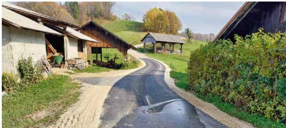
Cestni odsek skozi Padež

Občina Sevnica bo v letu 2025 nadaljevala z dinamiko sanacije najbolj poškodovanih cestnih odsekov.