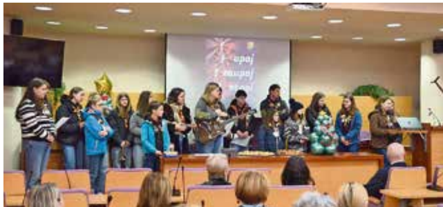
Luč miru tudi na Mestni občini Krško