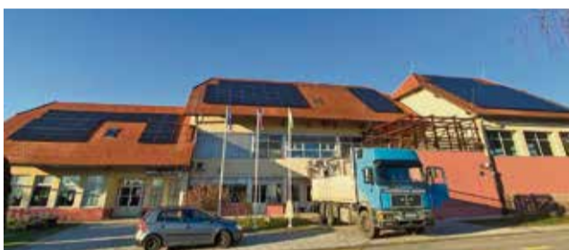
Sončna elektrarna na strehi Podružnične šole Kapele