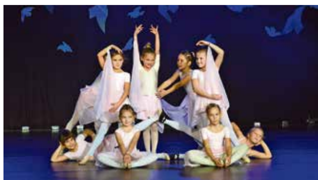
Baletna začetna skupina