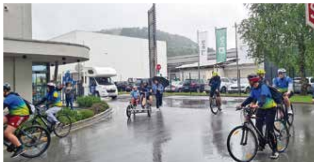
Letos je Deželak Junak v svoji akciji zavel tudi v krški I.H.S. d.o.o., kjer mu je obraz razsvetlila donacija zaposlenih, ki jo je še podvojilo podjetje.