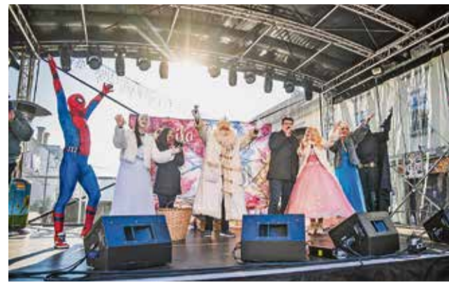
Odštevanje do otroškega novega leta z županom, direktorico ZPTM Brežice, dedkom Mrzom, vilo in filmskimi junaki

Prešerno rajanje sredi Brežic se je razumljivo nadaljevalo s prepevanjem različnih slovenskih in tujih hitov, na katere so