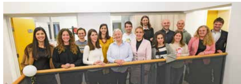
Izbrani podjetniki projekta KK Posel z mentorji in predstavniki Mestne občine Krško

Cilj programa KK POSEL je jasen – podpreti posameznike z inovativnimi idejami, da iz svojih hobijev ali strasti