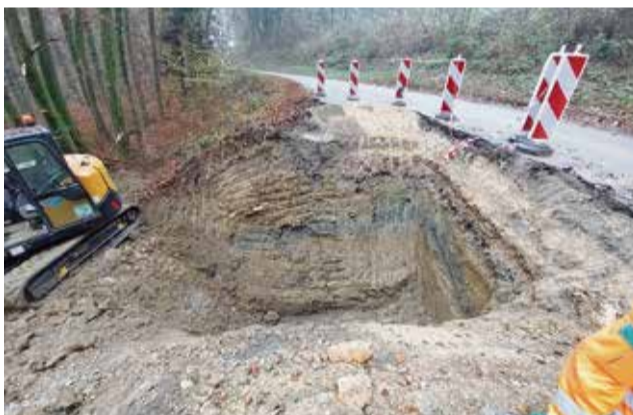
Na odseku Impoljca-Studenec je potekala izvedba drenažnega rebra in zamenjava ustroja ceste.