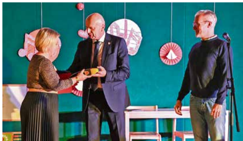
Župan ob predaji defibrilatorja ravnateljici