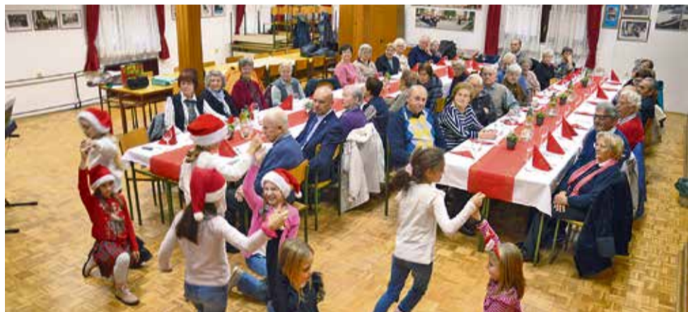
Za starostnike so kulturni program izvedle tretješolke z videmske osnovne šole.