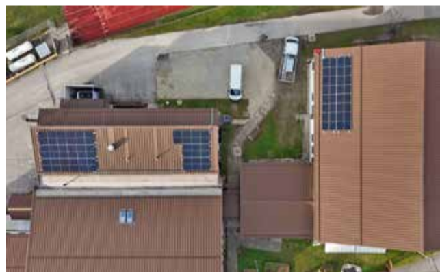
Sončna elektrarna na strehi OŠ Velika Dolina