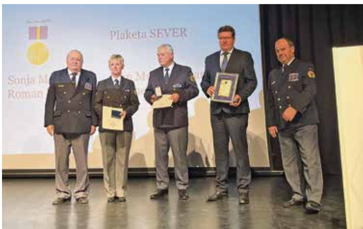
Prejemniki zlatih znakov in plakete Sever s podeljevalcema

N amen mitingov resnice je bil širjenje ideoloških sporočil, ki so promovirala centralizacijo Jugoslavije in politiko Slobodana Miloševića, takratnega predsednika SFRJ. »Akcija Sever je pokazala, da je bila Slovenija sposobna zavarovati svojo, tedaj še republiško suverenost in doseženo stopnjo demokracije. Takrat so se posavski in drugi miličniki ter ostali delavci organov za notranje zadeve izkazali kot odločilni varuhi slovenske suverenosti,«