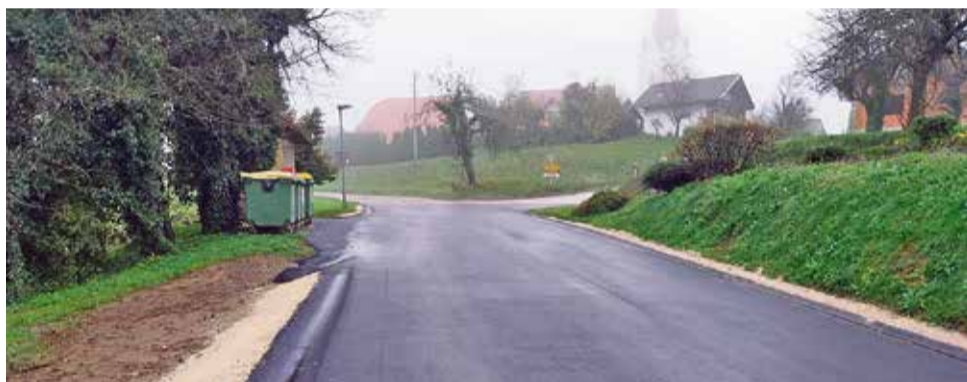
Cestni odsek na Slančjem Vrhu