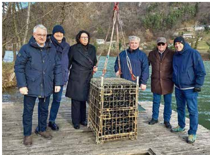
Sodelujoči pri potopu 300 steklenic penine v Savo

RADEČE – 24. decembra je potekal v pristanu Savus, ob izlivu Sopote v Savo, že 12. potop penine Valvasor v reko na nekajmesečno 'zorenje'.