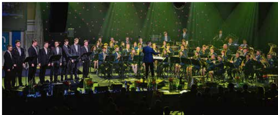
Godba Sevnica in Oktet Jurij Dalmatin

SEVNICA – V praznično urejenem športnem domu se je 21. decembra odvijala glasbena Božična pravljica, ki so jo ustvarjali članice in člani KD Godba Sevnica z glasbenimi gosti, člani Okteta Jurij Dalmatin iz Boštanja.