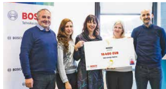
Predstavnici Hiše zavetja Palčica sta hvaležno sprejeli donacijo s strani Boscha.

Družbe in institucije pa izpolnjujejo svojo vlogo tudi na načine, o katerih ne razmišljamo direktno, ko govorimo o dobrih delih v okolju. Tak primer, ki se pri razmišljanju javnosti izpušča, je Nuklearna elektrarna Krško, ki kot upravljavec jedrskega objekta plačuje lokalnim skupnostim na območju omejene rabe prostora in na območju načrtovanja intervensijskih ukrepov nadomestilo za omejeno rabo prostora (NORP), ta sredstva pa, kakor pravijo, »so nato lokalnim skupnostim vir za naložbe, ki povečujejo kakovost življenja prebivalcev in lahko lajšajo stiske občanov.« Kot pojasnijo v NEK, vso proizvedeno električno energijo predajajo družbenikom, ne nastopajo na trgu električne energije in se ne poslužujejo marketinških akcij, vseeno pa dodatna donatorska sredstva namenjajo predvsem