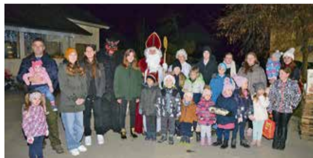
Obdarjeni otroci z Miklavžem in njegovim spremstvom

V spremstvu parklja in angelčka je prinesel darila 21 otrokom. Najmlajši so šteli komaj nekaj mesecev. Otroci pa niso bili pridni samo čez leto, ampak tudi na ta večer. Za svetega Miklavža so pripravili pester program. Najprej so mu zaigrali kratko predstavo o pridnem snežaku. Ob ritmih violine je sledila nekajminutna plesna predstava. Za konec pa je zadonela še harmonika. Otroci so se za program zelo lepo potrudili, kar je navdušilo tudi vse ostale navzoče, ki so jim namenili velik aplavz. Ko so otroci dobili svoja darila, je sledil še družabni del. Pridne roke