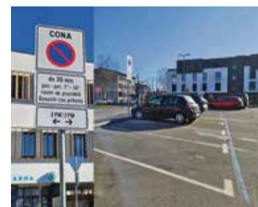
Označena parkirna mesta pred Zdravstvenim domom Brežice

Vsaka cona je ustrezno označena z modro črto in pojasnjevalno tablo. Pomembno je, da vozniki ustrezno OZNAČIJO ČAS parkiranja s parkirno uro ali listkom, na katerem je razvidna ura prihoda.