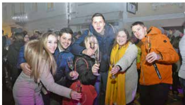
Vzdušje sredi Brežic je bilo razigrano.