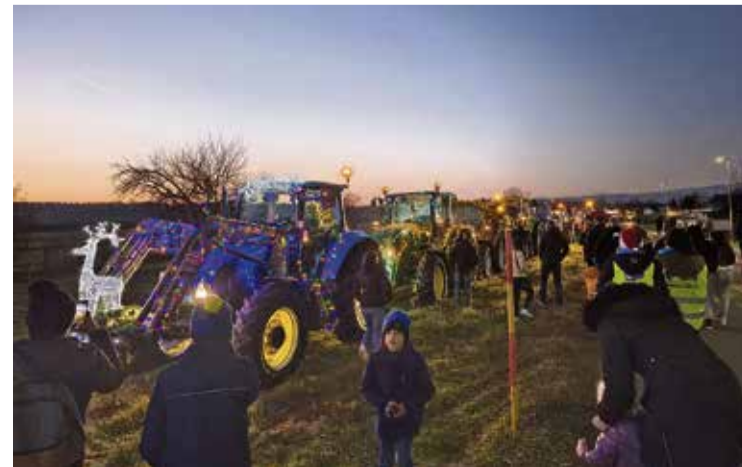
Med ogledom okrašenih traktorjev na Dolenji Pirošici