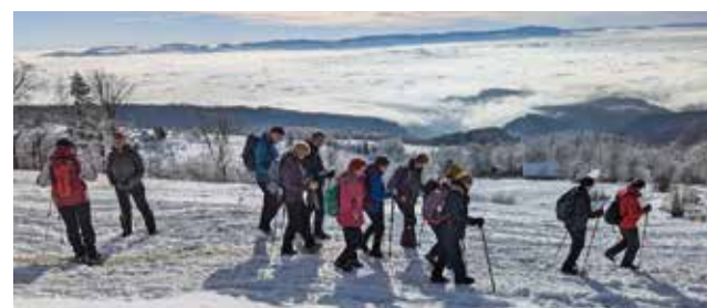
Pohodniki nad 'morjem megle' pod sabo