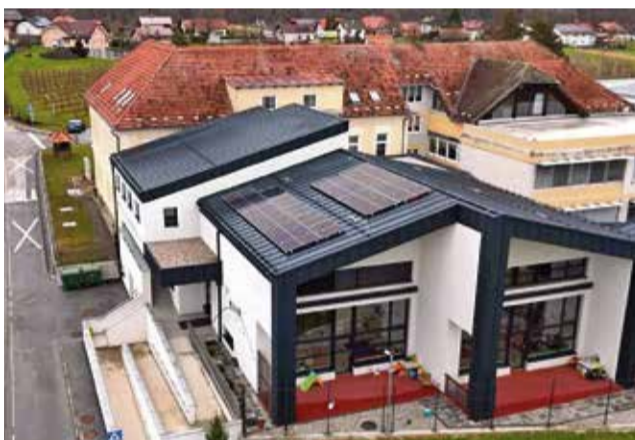
Sončna elektrarna na strehi OŠ in vrtca Artiče