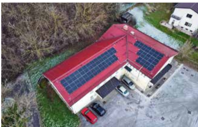
Sončna elektrarna na strehi Zdravstvene postaje Bizeljsko

Izvedba postavitve sončnih elektrarn je bila zaključena konec leta 2024, v decembru so bile tudi sklenjene pogodbe za individualno samozadostnost in oddane vloge za priključitev na elektro omrežje. Občina Brežice namerava nadaljevati investicije za povečanje energetske samozadostnosti v okviru načrtovane 2. faze projekta, ki obsega postavitve sončnih elektrarn na strehah 17 javnih objektov v lasti občine.