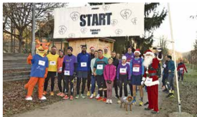
Tekačice in tekače je spodbujala tudi sevniška Lisička giba.