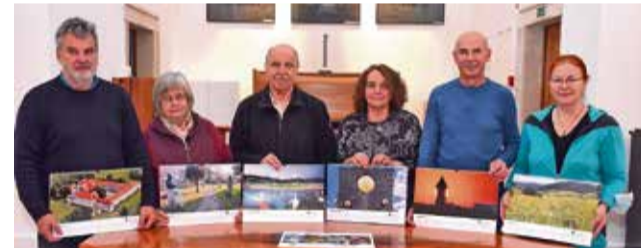
Skupinska fotografija članov DLF Krško

Odprtje razstave je s svojo prisotnostjo podprla vodja krške območne izpostave JSKD Tinka Vukič , ki je med drugim izpostavila, da umetniška oz. estetska fotografija predstavlja vrednoto, ki jo je treba negovati tako kot druge umetniške vsebine. »Pot