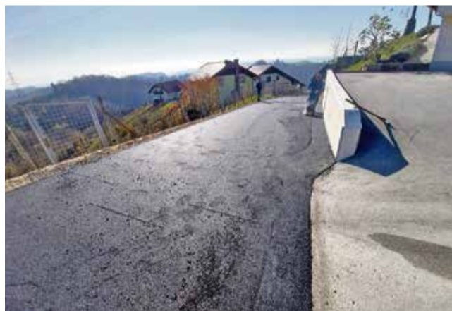
Asfaltiran odsek na Zgornjih Vodalah