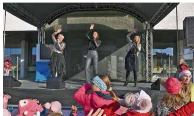
Razigrano otroško silvestrovanje s skupino Bepop