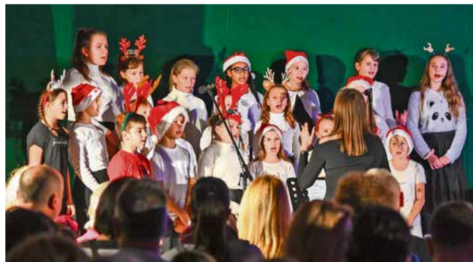
Predaja defibrilatorja je potekala v sklopu prazničnega koncerta, ki so ga pripravile učence in učenci Osnovne šole Raka.