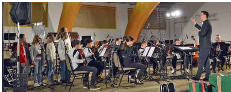
Harmonikarski orkester je spremljalo petje Otroškega pevskega zbora GŠ Brežice.