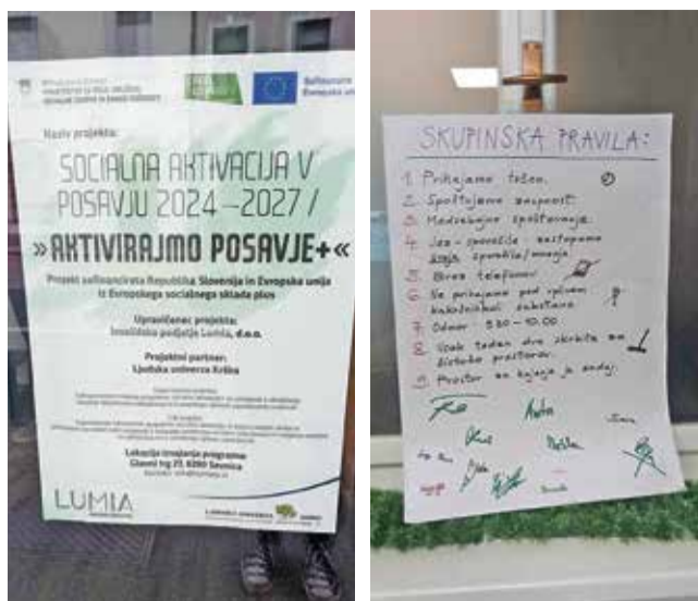
Udeleženci programa se srečujejo na Glavnem trgu v Sevnici.