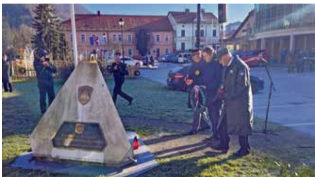
Položitev venca k spomeniku na vojno za samostojno Slovenijo