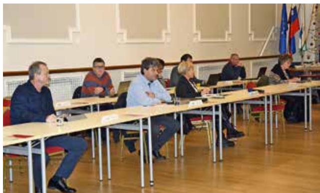
Proračun bodo potrjevali prihodnji mesec.