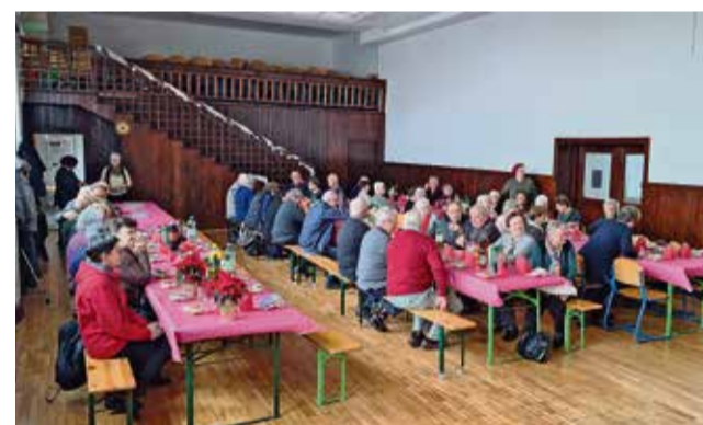
Udeleženci srečanja starejših iz KS Globoko