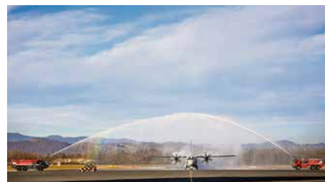
Letalski gasilci so drugo letalo Spartan pozdravili z vodnim slavolokom.