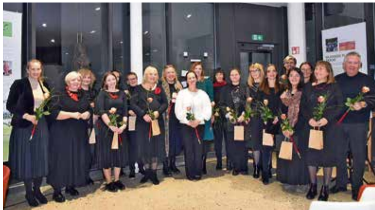
Vse nastopajoče tisti večer