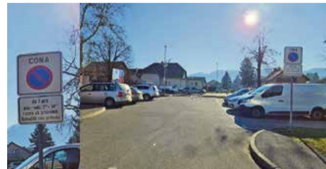
Označena parkirna mesta pri Tržnici Brežice