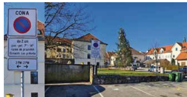
Označena parkirna mesta pri Vodovodnem stolpu