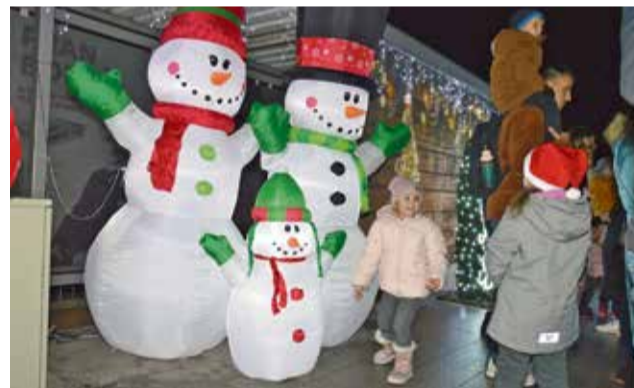
Tudi prireditve, ki lepšajo dneve, so sponzorirane. V Krškem se je 6. decembra na prižigu lučk, katerega pokroviteljica je bila tudi Nuklearna elektrarna Krško, zbralo veliko število domačinov, ki so navdušeno pozdravili začetek prazničnega utripa v mestu.