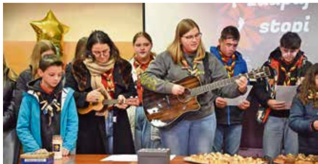
Skavti so prebrali poslanico z geslom »Upaj, zaupaj, stopi«.

Ob tem so prebrali poslanico z geslom »Upaj, zaupaj, stopi«, ki nas vabi k dejanjem solidarnosti in sočutja. Župan se jim je zahvalil za lepe želje in njihovo delo ter jim zaželel mir in prijetne praznične dni.