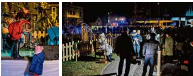
Prednovoletno druženje v Radečah