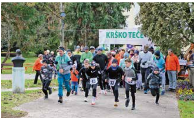
Teklo in hodilo je kar 250 udeležencev vseh starosti.