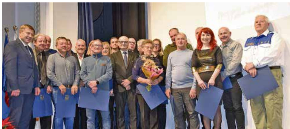
Jubilantke in jubiloti s predsednikom OOZ Sevnica in OZS

»Moram poudariti, da smo obrtniki in podjetniki eno veliko podjetje, ki zaposluje zelo veliko delavk in delavcev, a nam država tega ne priznava in nam znova in znova nalaga nove obveznosti, a nekeje so meje, ko tega ne bo več mogoče prenašati. Letošnje