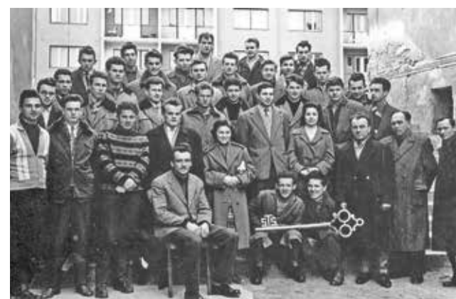
Generacija strojnikov 1958–1962 s profesorji in iskanim ključem v ospredju