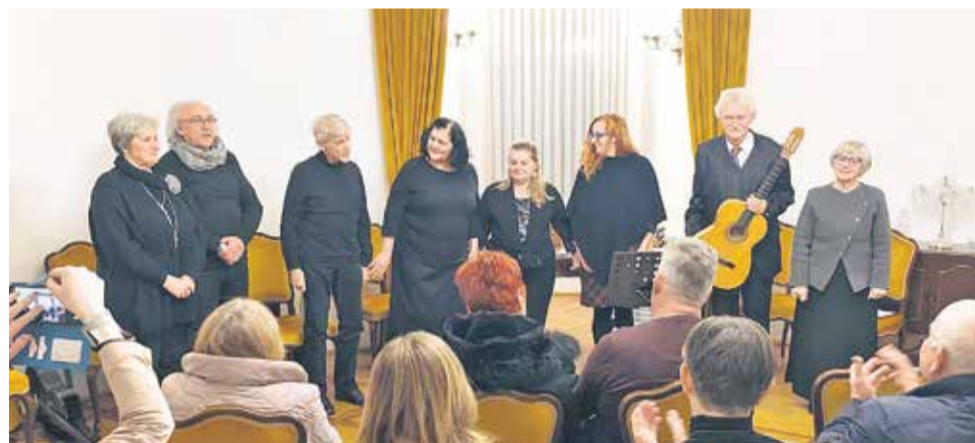
Nastopajoči in del občinstva v poročni dvorani Posavskega muzeja Brežice