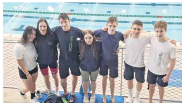
Krška plavalna zasedba na zimskem DP v Ljubljani