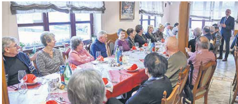
Srečanje je bilo namenjeno druženju, obujanju spominov na skupna leta dela ter izmenjavi pogledov na razvoj občine.

Tudi letos Mestna občina Krško izvaja vrsto pomembnih investicij, kot sta gradnja Bazena Krško in Parka urbanih športov, ki bosta zaključena v letošnjem letu. Intenzivno potekajo aktivnosti za pričetek gradnje OŠ dr. Mihajla Rostoharja Krško, ki je predvidena v prvi polovici leta. Med drugim je župan spomnil na številne zaključene projekte na prometni in komunalni infrastrukturi, kot so rekonstrukcija Ceste na ribnik, kanalizacija na Raki, pločniki na Senušah, sanacija pobočja Beli pesek in ureditev dela večnamenske poti ob Savi. Nadaljuje se obnova Kapucinskega samostana, izvajanje projekta Grajske sanje z delno obno-