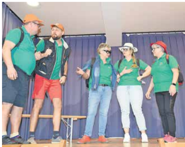
Člani Društva za ohranitev podeželja Veliki Trn so uprizorili skeč Svetoduščani grejo na izlet.

VELIKI TRN – Na Velikem Trnu, središču krajevne skupnosti v Krškem gričevju, so že enajstič pripravili prireditev Ocvirki in vino, v organizaciji Društva za ohranitev podeželja in Društva vinogradnikov Veliki Trn.