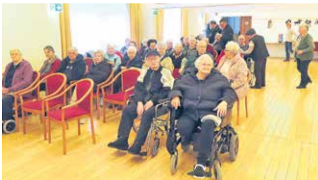
Zbrani na srečanju v dvorani TDU Loka