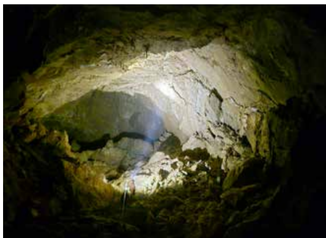
... so prišli v 'Dvorano za devetimi gorami' ...