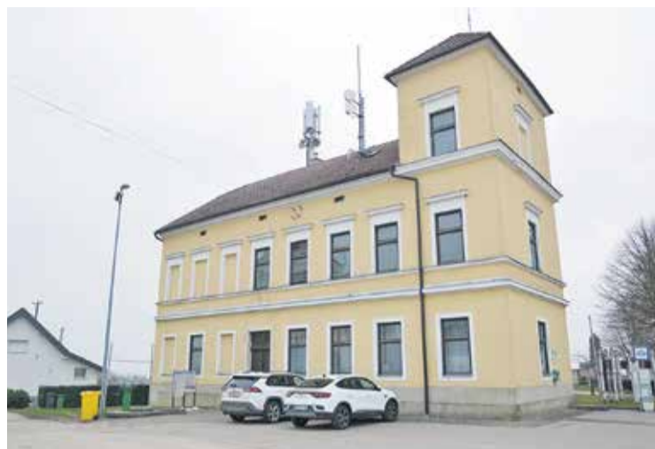
V okviru projekta bodo med drugim v stari OŠ urejeni in opremljeni prostori za druženje in delovanje društev.