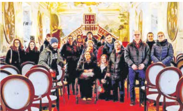
Udeleženci projekta v Viteški dvorani