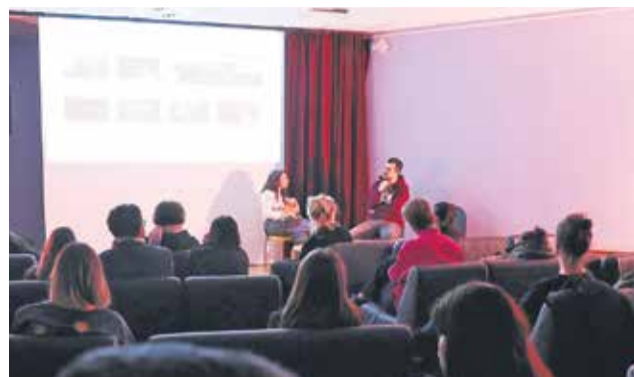
Mednarodni dogodek v KD Krško.

Posebej zanimiv je bil zaključni pogovor v Brestanici, kjer so članice žirije delile konkretne poglede na pogoje za ustvarjanje in soočale izkušnje dela v različnih državah. Na izraz v filmu vplivajo tako zunanje okoliščine, družbene razmere, pogoji za snemanje kot notranji svetovi ustvarjalcev – Kukla se je zazrla tudi v pomen telesne izraznosti, Talita v analogne tehnike