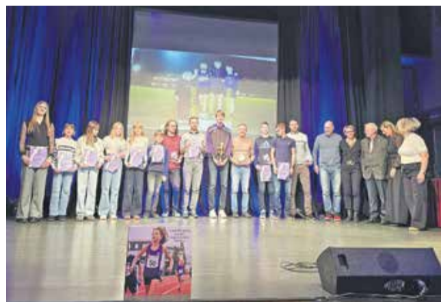
Prejemniki priznanj in zahval z atletom leta 2025 (v sredini s pokalom) in slavnostno gostjo (četrti z desne)