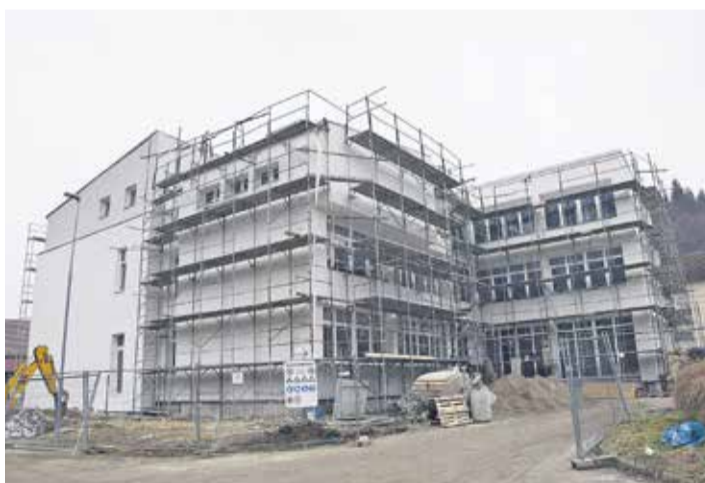
Obnova sevniške srednje šole se počasi bliža zaključku.

SEVNICA – Srednja šola Sevnica bo kmalu imela novo zunanjo podobo in funkcionalno notranjo razporeditev prostorov. Prenova, ki se je začela maja lani, bo zaključena v letošnjem marcu.