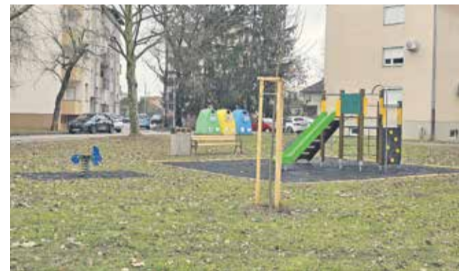
Igrala v mestnem parku pri Šolski ulici

Tudi z manjšimi projekti Občina Brežice dolgoročno skrbi za urejene, dostopne in kakovostne zelene javne površine. Veselimo se pomladi, ko bo mestni park ozelel ter s svojo novo podobo postal še prijetnejši prostor za druženje in sprostitvev.