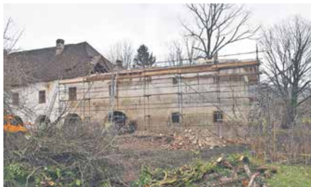
Zaradi dotrajanosti bo zamenjana celotna strešna konstrukcija.