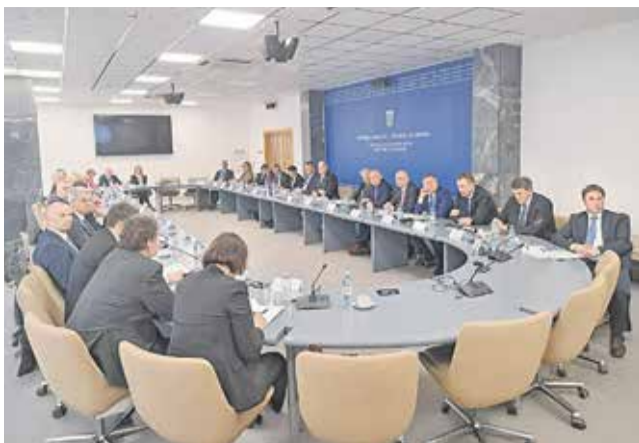
Z 18. zasedanja meddržavne komisije v Zagrebu