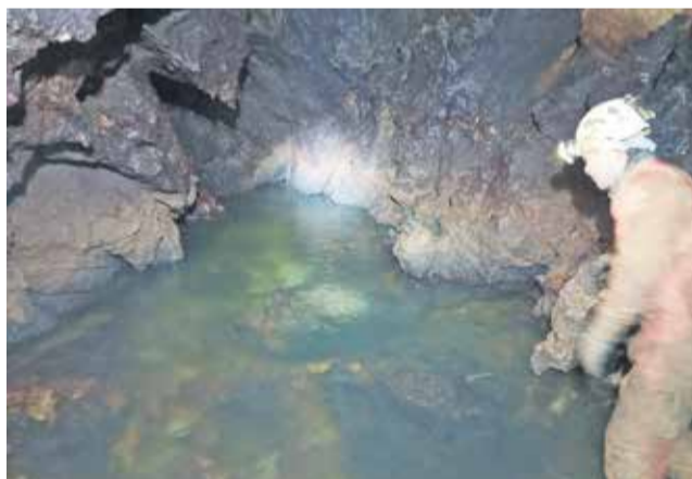
... in nato še do podzemnega vodnega sistema, ki je, kot domnevajo, del potoka Studena.