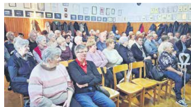
Udeleženci ponovoletnega druženja so najprej prisluhnili praznično obarvanemu programu.