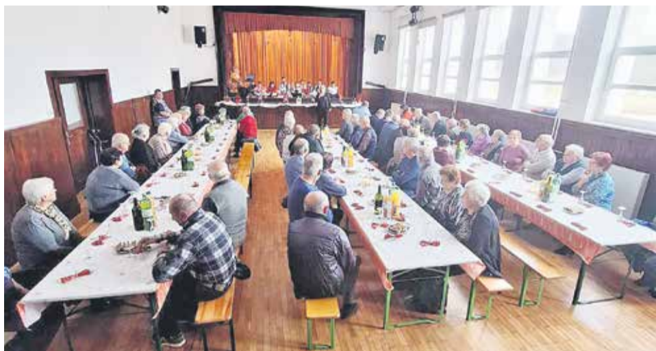
Srečanje je potekalo v dvorani Prosvetnega doma v Globokem.

GLOBOKO – Prostovoljke Krajevne organizacije Rdečega križa (KO RK) Globoko so 6. decembra organizirale srečanje starejših krajanov, ki so dopolnili 70 let ali več.