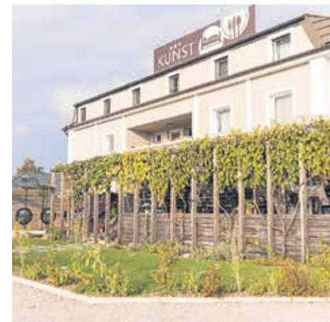
Gostilna in hotel Kunst

Vodstvo in zaposleni v Gostilni in hotelu Kunst so že pred časom sprejeli odločitev, da svojo obstoječo zeleno politiko nadgradijo, jo tudi formalno umestijo v svoje poslovanje ter preko mednarodnih standardov preverijo svoje trajnostno naravnano delovanje, in sicer tako, da izvedejo postopek certificiranja za pridobitev trajnostnega certifikata Good Travel Seal – za gostinske obrate/namestitve in naknadno certifikata Slovenia Green .