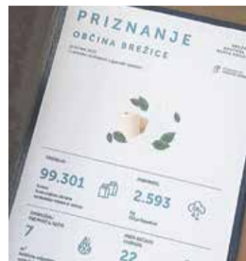
Priznanje Občini Brežice

Veseli nas, da so v programu Krožna kultura v naših rokah vključene tudi številne organizacije, javni zavodi, šole in podjetja z območja občine Brežice. Med njimi so Splošna bolnišnica Brežice, Zdravstveni dom Brežice, Komunala Brežice d.o.o., Posavski muzej Brežice, Osnovna šola Breži-