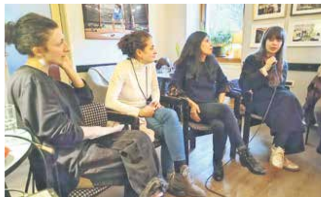
Festival so v klubu Pod lipo s spodbudami zaključile članice žirije.

nastajanja scenarijev s svojimi beleškami oziroma projektnimi bloki, Setareh pa je povzela prehajanje med kulturami: »Zame je delo v Iranu in Franciji povsem različno. Tam nimam istih sanj kot pri snemanju v Parizu. Ugotovila sem, da ko razmišljam v perziščini – ali v francoščini –, nastane povsem drugačen rezultat. Jezik je izjemno pomemben, povezan je s spominom.«