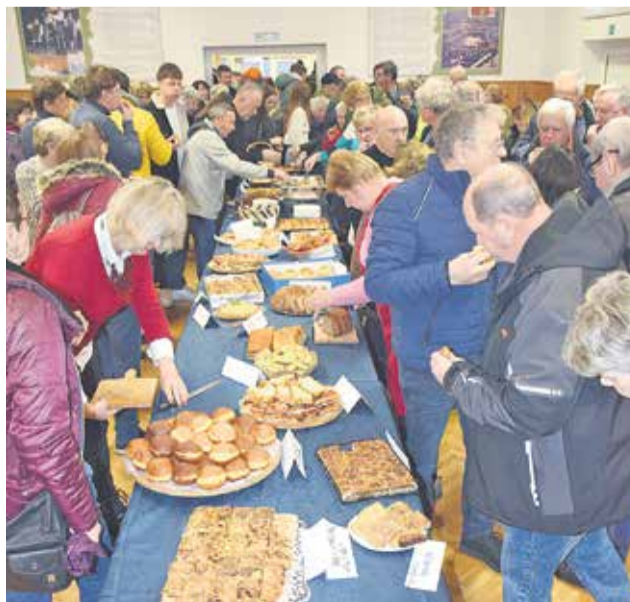
Sledila je degustacija številnih domačih dobrot z ocvirki.

Odličan obisk osrednje zimske prireditve v krajevni skupnosti, ki povezuje več kot 20 vasi na 300 in več metrih nadmorske višine, dokazuje, da so ljudje še vedno željni tovrstnega druženja. PETER PAVLOVIČ