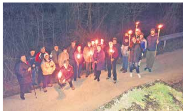
Pot so si osvetljevali z baklami številnih udeležencev.

Čeprav nas luna zaradi oblačnega vremena ni obsijala, so nam na poti svetile bakle številnih udeležencev. Ob pokušanju vin v naslednjih kletih se je že slišala pesem, na končni desti-