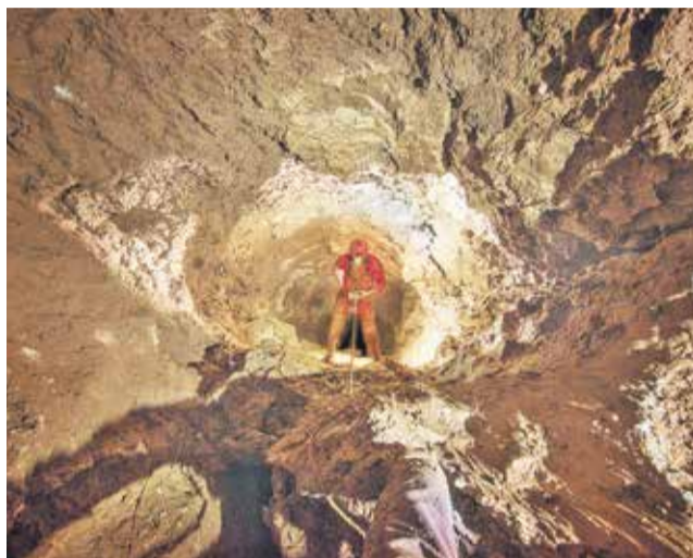
Skozi brezno Gorjanc s potrjeno globino več kot 300 metrov ...