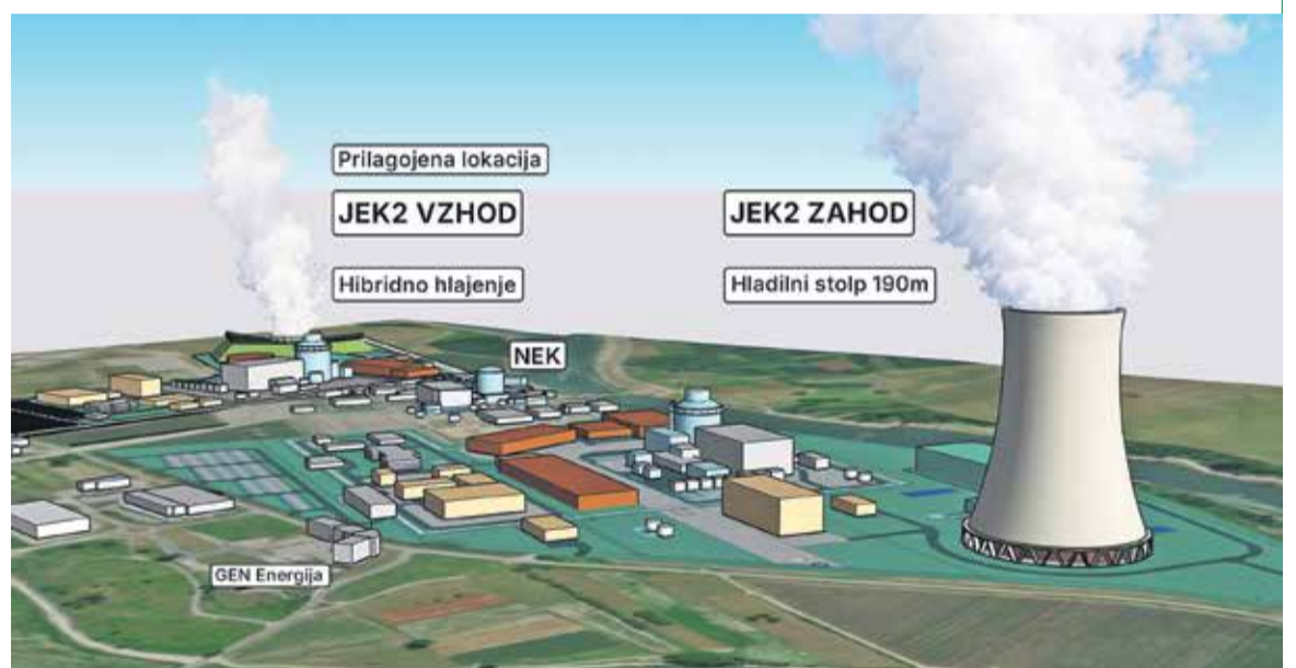
Slika 1: Primerjava JEK2 Zahod, s prilagojeno lokacijo JEK2 Vzhod, za obstoječo NEK. Na vzhodu je prikazan preizkus umestitve, z uporabo nizke hibridne hladilne tehnologije, z manj izpusti pare. (3D vizualizacija: Mestna četrt Leskovec)

Odločilen dejavnik je tudi naša skupna okoljska odgovornost. V Krškem imamo problematične izkušnje z bremenom