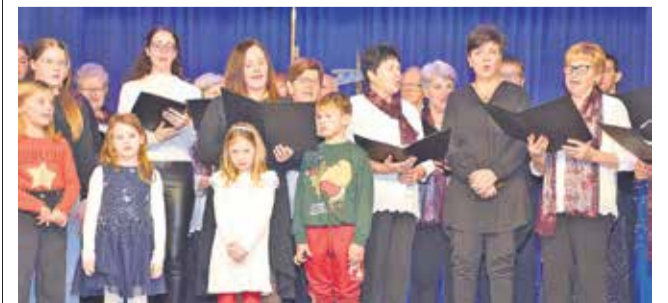
Pod trikraljevsko zvezdo so zapeli pevci in pevke vseh generacij.