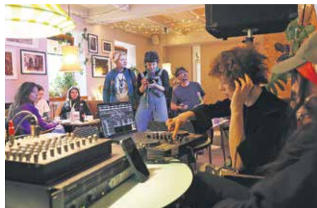
Festival je misli sidral tudi v glasbi.