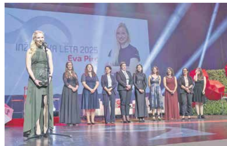
Generacija nominirank za inženirko leta 2025