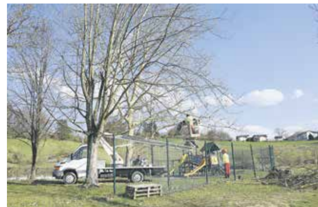
Poseku je sledilo še obžaganje dreves.