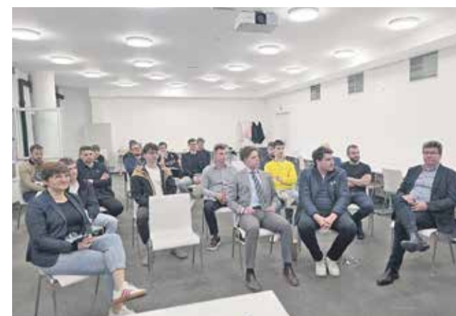
Zbrani na ustanovnem zboru SDM Brežice