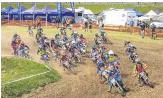
Na Pilipah je bilo zelo zanimivo v vseh vožnjah.