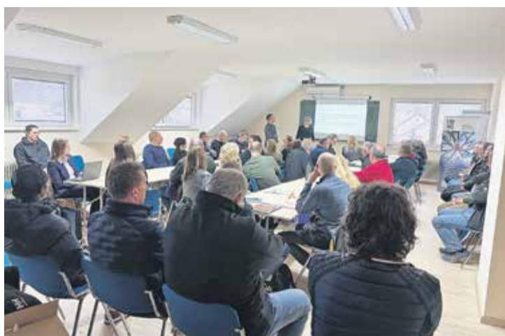
Zaposlitvenega dogodka se je udeležilo okoli 30 nekdanjih zaposlenih Vipapu.

Kot je naknadno sporočila Janja Starc, so največji ponu-