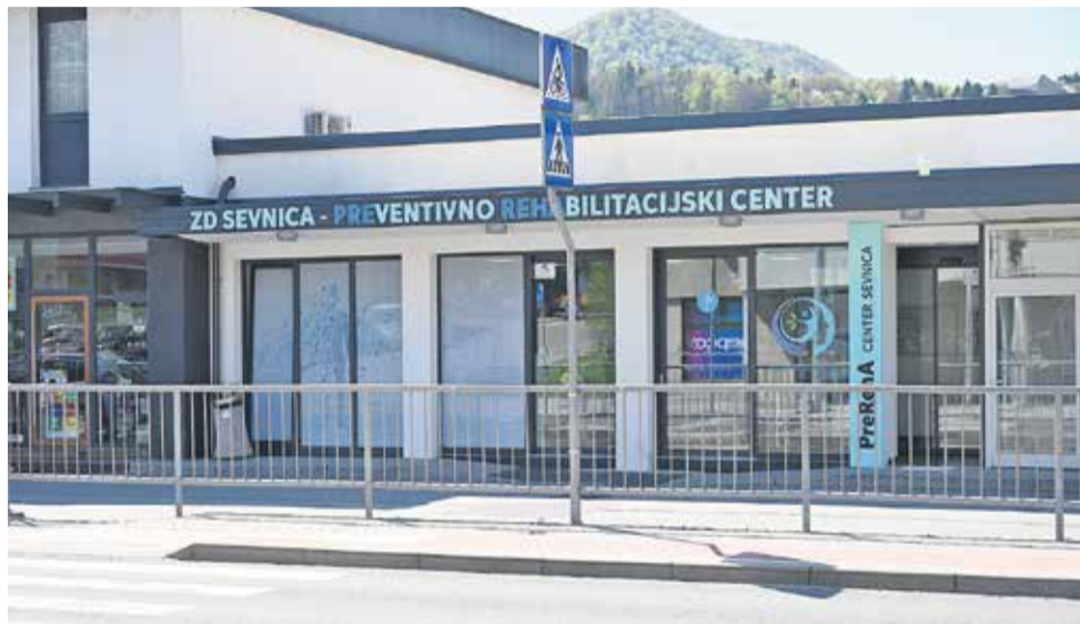
Preventivno rehabilitacijski center Sevnica

Svetovni dan zdravja, ki ga vsako leto 7. aprila obeležujemo pod okriljem Svetovne zdravstvene organizacije, letos v ospredje postavlja pomembno sporočilo: pri skrbi za zdravje je treba zaupati znanosti. V času, ko smo vsakodnevno izpostavljeni množici informacij, med njimi tudi nepreverjenim in zavajajočim, postajajo znanstveno utemeljeni podatki ključni kompas pri sprejemanju odločitev o zdravju.