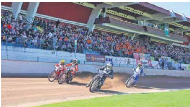
Dirko je v lepem vremenu spremljalo kar 2000 gledalcev.