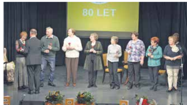
Organizacijski odbor je pripravil zbornik in slovesnost ob 80-letnici DU Sevnica.