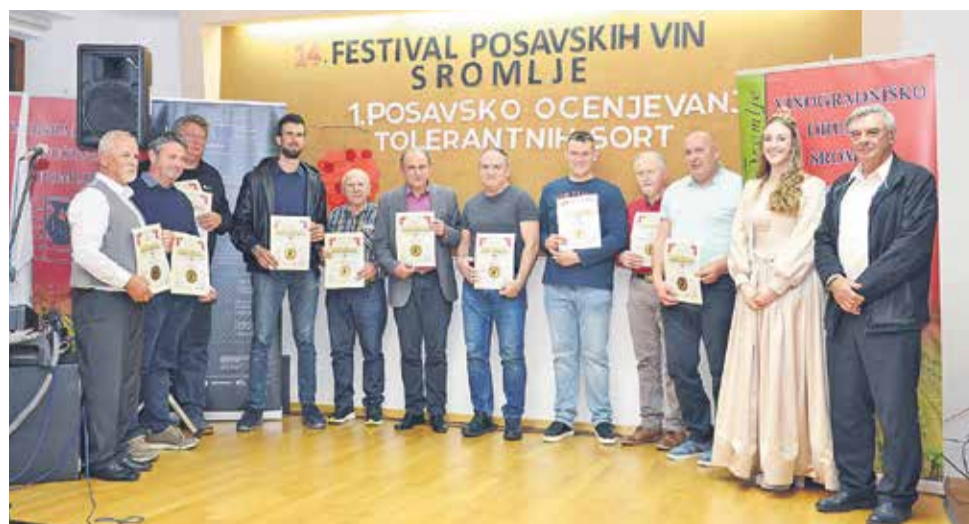
Z zlatimi medaljami nagrajeni vinarji za tolerantne sorte in beli bizeljsčan PTP s podeljevalcema