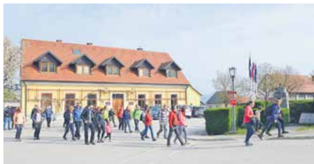
V Bistrici ob Sotli se je lepo število pohodnikov izpred občinske stavbe odpravilo na voden pohod do gradu Kunšperk.

Počakovo in Svibno v radeški občini povezala umetnost, roko-delstvo in zgodovina, od bogate likovne razstave do trškega dne in oživljene legende o vitezih Ostrovrharjih. V ponedeljek je radovedneže pot vodila še po sledeh cistercijanov v kostanjeviški