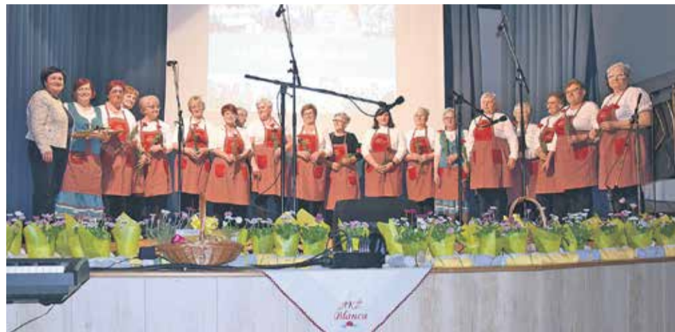
Članice AKŽ Blanca s predsednico Društva kmetič Sevnica

BLANCA – Prizadevne članice Aktiva kmečkih žena Blanca so 21. marca v domači kulturni dvorani obeležile 35 let delovanja. Prireditev je bila ob glasbi in govornih besedi ter razstavi preplet bogate kulturne dejavnosti in kulinaričnih zgodb.