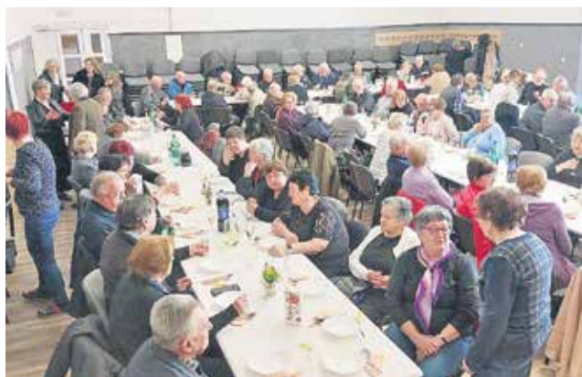
Dogodek je združil kar 113 udeležencev.