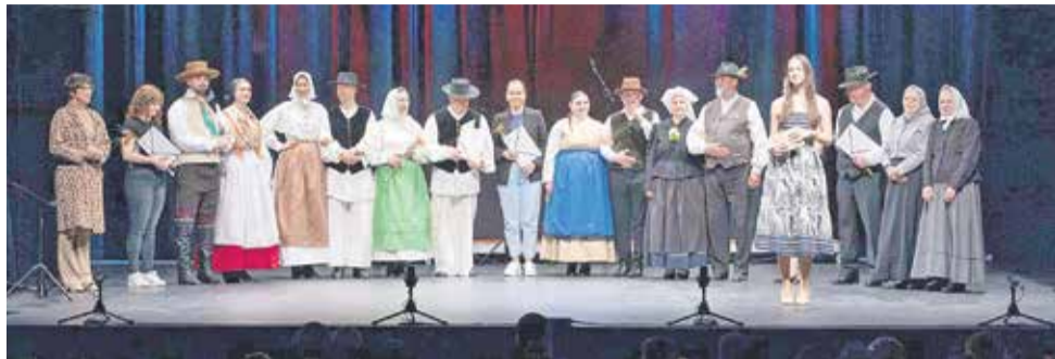
Predstavniki folklornih skupin in umetniške vodje po podelitvi priznanj za sodelovanje.

BREŽICE – V prenovljeni dvorani Doma kulture Brežice je potekalo Maroltovo območno srečanje folklornih skupin. Predstavilo se je pet odraslih folklornih skupin, ki že vrsto let delujejo na območju Posavja.