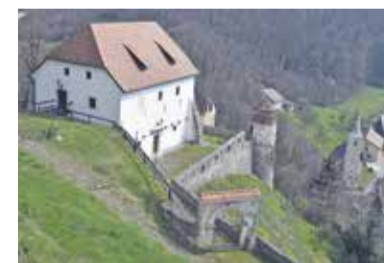
Bodoči načrti so povezani tudi z ureditvijo okolice Lutrovske kleti.