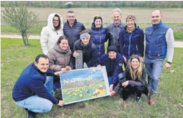
Sajenje dreves ob Savi

s čimer so izrazili podporo okoljskim pobudam. Občina je letos preko razpisa Čebelarke zveze Slovenije prejela 12 sadik srebrne lipe in 12 sadik sadnega drevja, nekaj dreves je občina namenila tudi zainteresiranim osnovnim šolam in