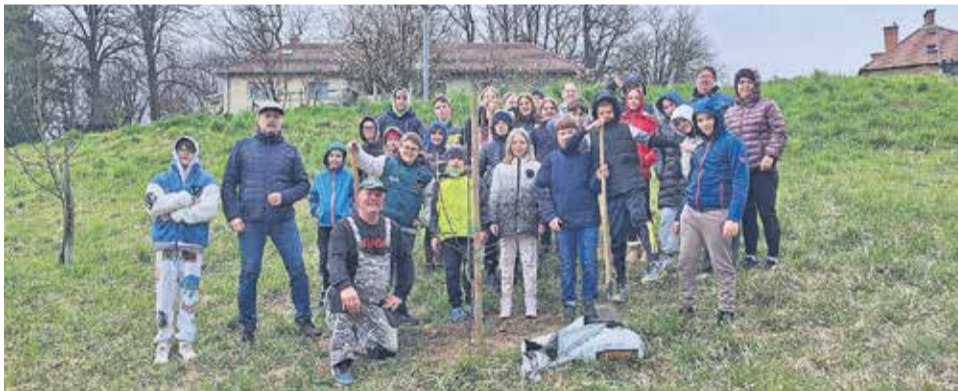
Udeleženci naravoslovnega dne ob zasajenih jablanah

SENOVO – Člani Turističnega društva Senovo smo 1. aprila, v sodelovanju s partnerjem v projektu Evrosad d.o.o. Krško, sodelovali pri izvedbi naravoslovnega dne za učence 6. razreda OŠ XIV. divizije Senovo. Projekt opo-