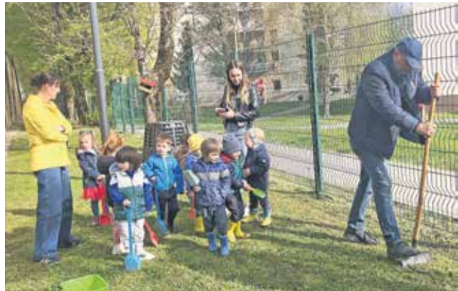
Pri sajenju dreves pri šolah in vrtcu so sodelovali tudi otroci.

Občina Brežice v letu 2026 nadaljuje spodbujanje zasaditve medovitih rastlin, ki pomembno prispevajo k ohranjanju narave in opraveševalcev. Ob sprehajalni poti ob Savi so zaposleni občinske uprave Brežice zasadili nova medovita drevesa,