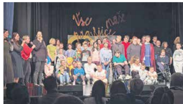
Nastopajoči so z dobrodelnim dogodkom pokazali, da je njihov otroški svet pisan in bogat.