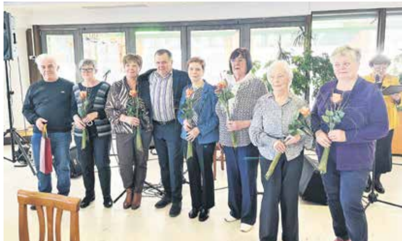
Najzaslužnejši za delovanje brežiškega koronarnega kluba: vaditelji, strokovna vodja, predsednik, zvesti člani, ki so prejeli zahvale.

BREŽICE – V soboto, 28. marca, je v restavraciji Štefanič v Brežicah potekala slovesnost ob 20-letnici delovanja Koronarnega kluba Brežice, enega izmed 19 slovenskih koronarnih klubov.