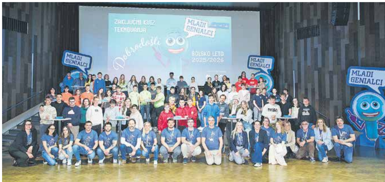
Vse sodelujoče ekipe z mentorji in organizatorji tekmovanja

KRŠKO – V Kulturnem domu Krško je minuli torek v organizaciji GEN energije in Nuklearne elektrarne Krško (NEK) potekalo že 13. tekmovanje Mladi genialci, letos namenjeno osnovnošolcem. V napetem finalu se je pomerilo 17 ekip posavskih osnovnih šol, največ znanja o energetiki pa so pokazali učenci osnovnih šol z Rake, Brežic in Brestanice.