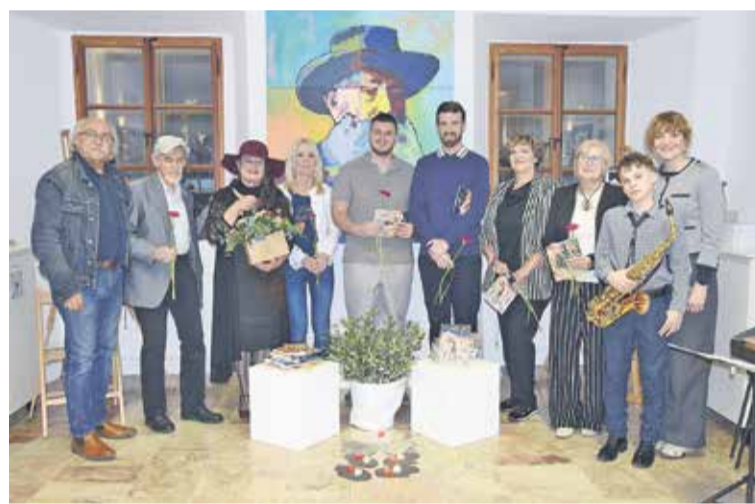
Sodelujoči na literarnem večeru z besedno ustvarjalko (tretja z leve)