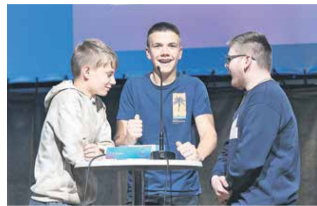
Zmagovalna ekipa OŠ Raka