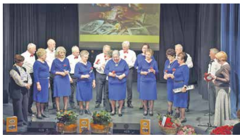
Vsi nastopajoči, med njimi tudi MePZ Srebrni glas, so prejeli ročno izdelane nageljčke ročnodelske skupine Marjetice v znak spoštovanja in hvaležnosti.