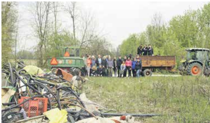
Udeleženci čistilne akcije z zbranimi odpadki