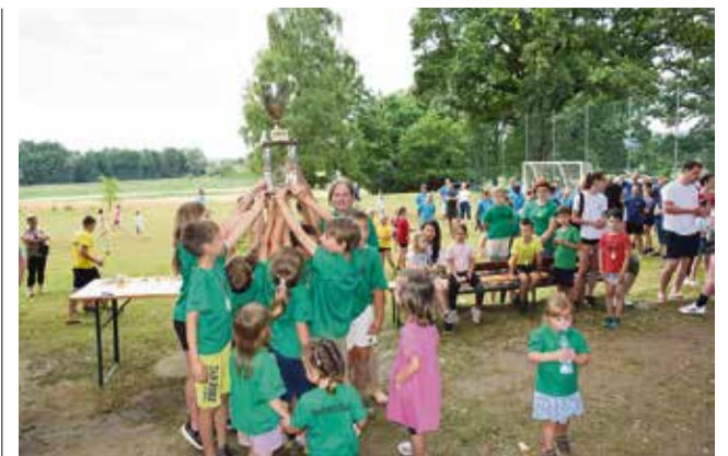
Goriški otroci so dvignili prehodni pokal za skupno zmago na vaških igrah.