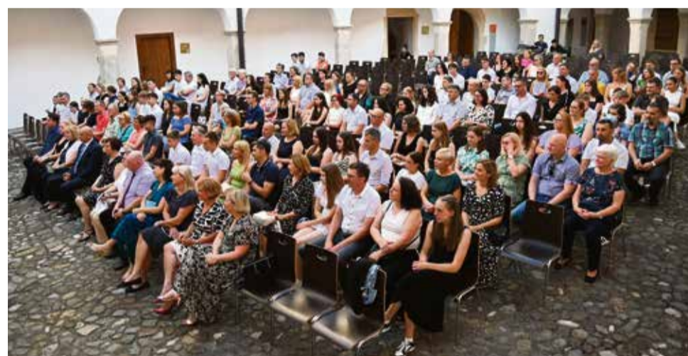
Navzoči na županovem sprejemu