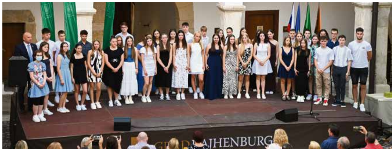
Najuspešnejši učenke, učenci in dijaki z županom