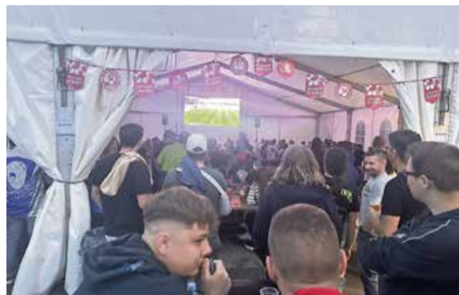
Nabito polna Fan cona med tekmo Slovenija - Anglija