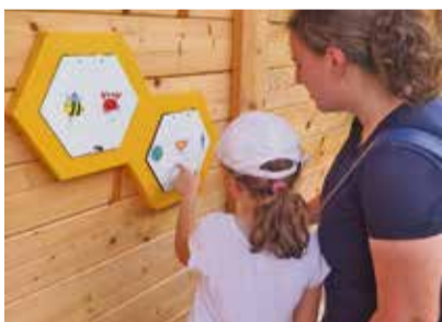
Pešpot je opremljena z didaktičnimi učili.