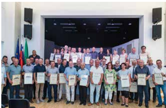
Prejemniki jubilejnih priznanj in vodstvo zbornice