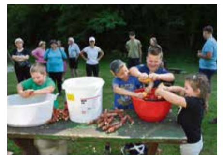
Za popestritev so tekmovali tudi otroci.

KOBILE – V sklopu praznika Mestne četrti Leskovec pri Krškem so v vaščani Kobil na igrišču »na Gmajni« pripravili druge kmečke igre. Zaradi ostalih dogodkov v občini so tokrat v žaganju drv, vlečenju vrvi, streljanju z lokom,