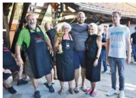
Zmagovalna ekipa osme golažijade s podeljevalcema