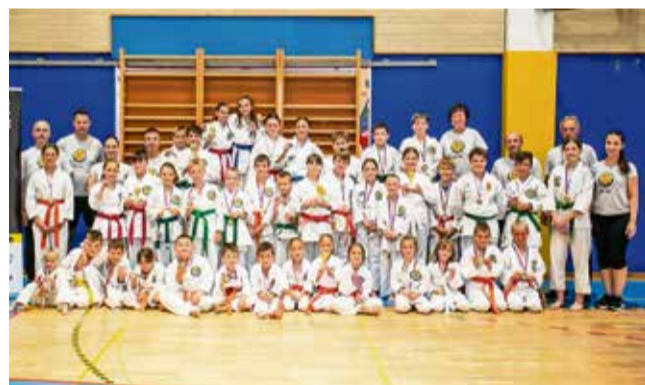
Udeleženci tekmovanja v katah s trenerji