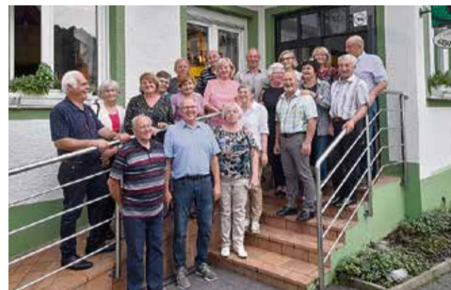
Zbrani na srečanju v gostilni Gadova peč