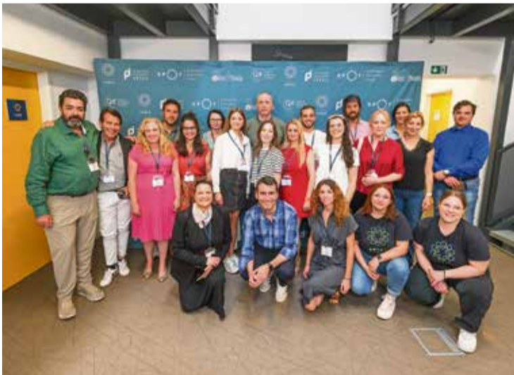
Udeleženci srečanja v Krškem

V popoldanskem delu so udeleženci po ulicah starega mestnega jedra izvajali intervjuje in se pogovarjali z lokalnimi prebivalci predvsem o vprašanjih, ki se dotikajo prednosti življenja v Evropski uniji in kakšne koristi jim to prinaša. Tudi o tem, kakšno