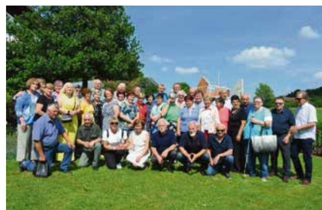
Udeleženci srečanja generacije 1968/69