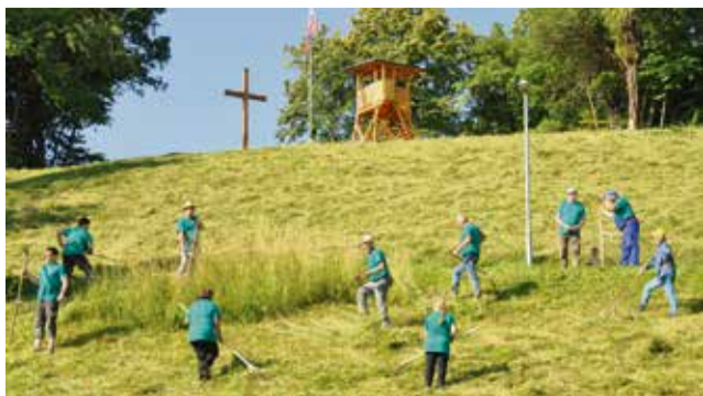
Na vrhu Cavsarja so postavili razgledni stolp, drog z zastavo in križ.