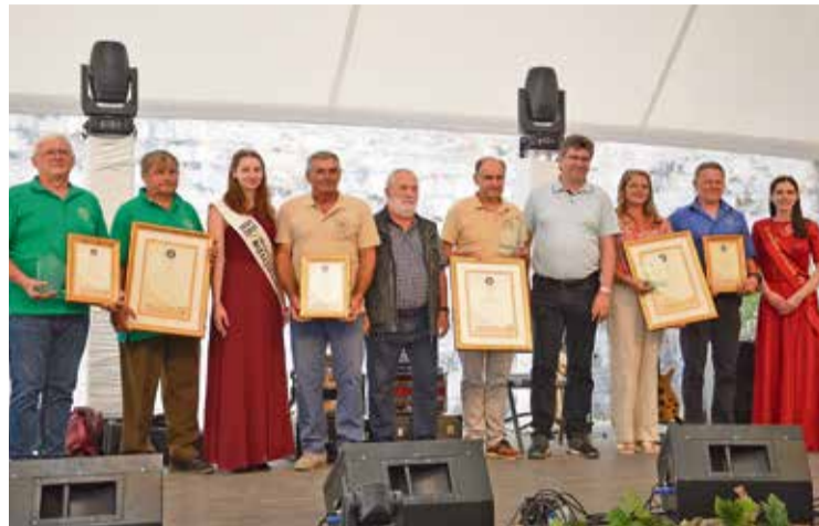
Najboljši v izboru županovega vina s predsedniki vinogradniških društev, županom ter aktualnima vinsko kraljico Bizeljskega in cvičkovo princeso

Tekmovanje v peki domačega kruha je bilo eden izmed osrednjih dogodkov, v okviru katerega so se ljubitelji pekovskih mojstrov in pomerili v pripravi najboljšega kruha v petih kategorijah. Razstavljeni izdelki