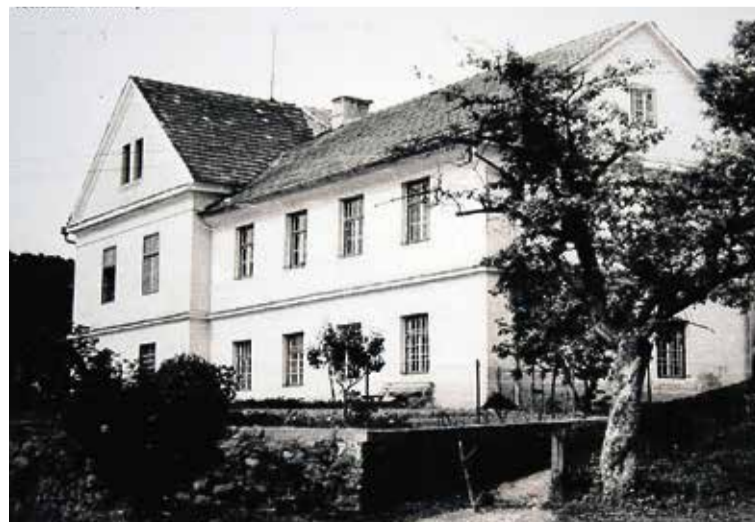
Na razstavi v prostorih šole je tudi fotografija nekdanje šolske stavbe na Agrežu.