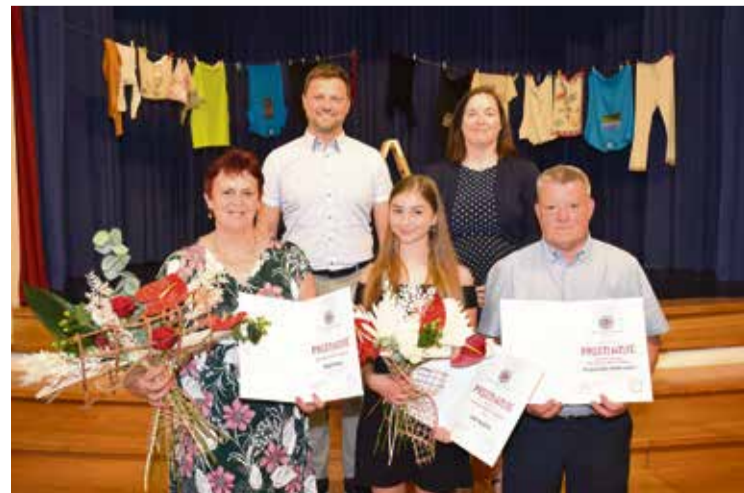
Sprejaj krajevni nagrajenci, zadaj predsednik KS in direktorica OU