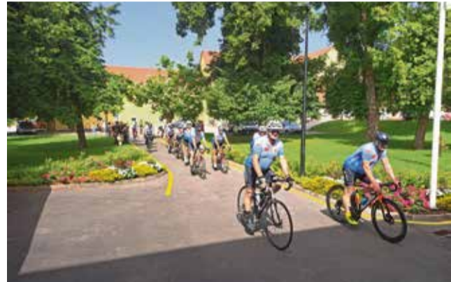
Kolesarska karavana se je na poti od Vukovarja do Ljubljane ustavila tudi v Sevnici.