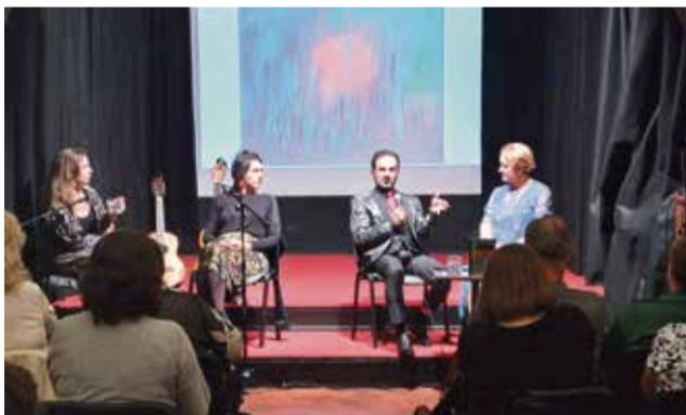
Pogovor s slikarjem ob glasbi v Albert Felicijanovi dvorani