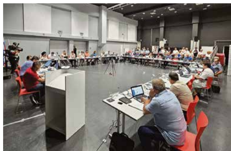
Brežiški občinski svet in povabljeni gostje na izredni seji

Svetnice in svetniki so po več kot triurni razpravi soglasno sprejeli šest sklepov, in sicer da Občinski svet Občine Brežice (1) ostro obsoja kakršnokoli obliko nasilja, posebej medvrstniško nasilje znotraj javnih ustanov in zavodov, še posebej v šolah