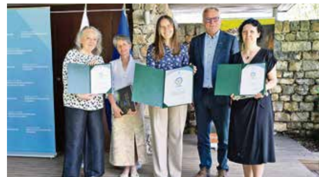
Slovesna podelitev v Parku Škocjanske jame (foto: STA)

P. P./VIR: MO KRŠKO, FOTO: OBRтна ZBORNICA SLOVENIJE