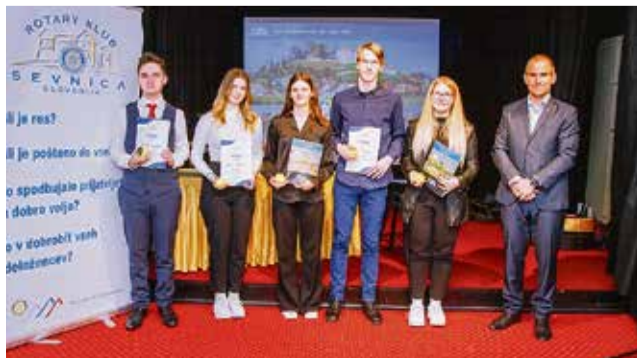
Prejemniki štipendije z aktualnim predsednikom Rotary kluba Sevnica