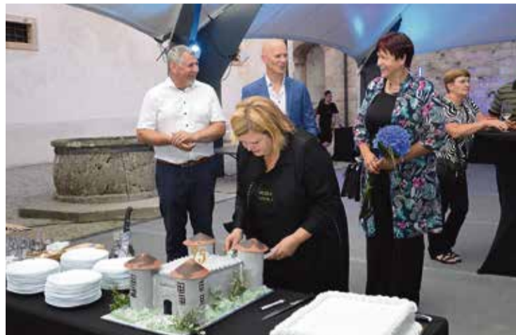
Med razrezom rojstnodnevne torte v obliki gradu

Osrednji del projekta »Muzejski donatorji – ožilje muzeja« je namenjen slikarki in pedagoginji Alenki Gerlovič (1919–2010), ki je muzeju podarila večji del svojega fonda, ter Ivanu Ivačiću (1921–