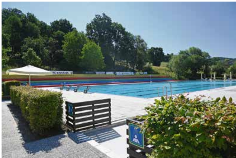
Bazen Sevnica vabi k prijetni poletni ohladitvi.

Čas šolskih počitnic za mlade občanke in občane ponuja veliko priložnosti za sproščeno druženje in sklepanje novih prijateljstev ob preživljanju prostega časa na prostem. V vseh večjih krajih po občini je dostopna raznolika prostočasna infrastruktura, ki vabi k uporabi.