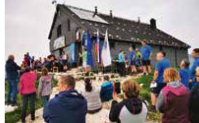
Slovesnost ob 70-letnici kočice

V soboto, 29. junija 2024, je v Zasavski koči na Prehodavcih v Julijskih Alpah potekala 10. redna seja Občinskega sveta Občine Radeče. Nena- vadni lokaciji, kar pošteno stran od domačih Radeč, je botrovala okrogla obletnica, 70 let te priljubljene visokogorske postojanke, s katero že od leta 1956 naprej upravlja Planinsko društvo Radeče. Koča je bila namreč zgrajena kot skupen projekt zasavskih planinskih društev iz Zagorja, Trbovelj, Hrastnika in Radeč, ki so z njo prvi dve leti upravljala skupaj, nato pasu upravljaj- nje in vzdrževanje prepustili radeškemu društvu. V letu 2004 je koča po dogovoru s preostalimi lastniki v celoti prešla v last Planinskega društva Radeče, v zahvalo