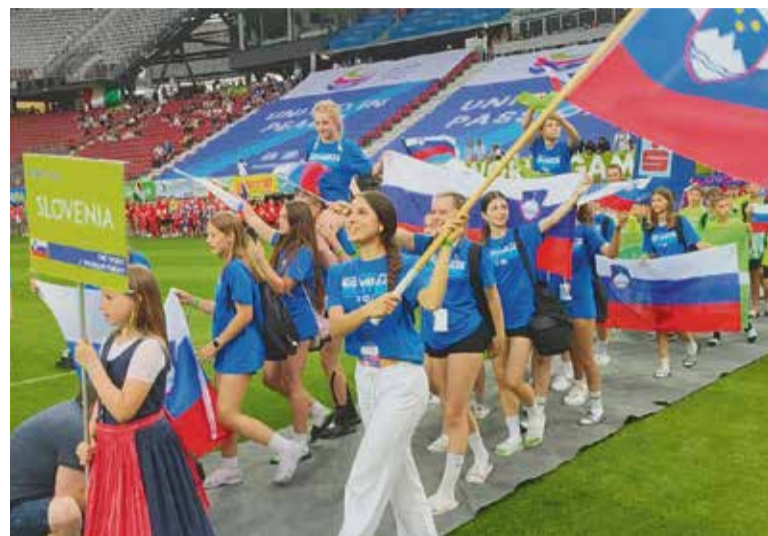
Krško zastopstvo na otvoritveni slovesnosti

Skupno sodelovanje športnih društev občine Krško s Športno