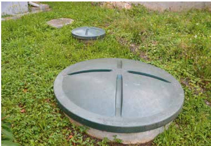
Za aglomeracije, manjše od 500 PE, so ugotovili, da strošek javne kanalizacije za več kot trikrat presega strošek opremljanja z ZMKČN (na fotografiji).

Občina Brežice po aktualnih določilih obsega 26 aglomeracij. Z izgradnjo centralnega kanalizacijskega sistema in centralne čistilne naprave (CČN) Brežice ter čistilne naprave Obrežje in Globoko s pripadajočim kanalizacijskim omrežjem je opremila devet aglomeracij. Aglomeracije Gornji Lenart (vključno z naseljem Brežice), Mostec, Veliki Obrež, Loče-Brežice in Čatež ob Savi se priključujejo na CČN Brežice. V gradnji je kanalizacija za aglomeraciji Krška vas in Artiče, ki se bo priključevala na centralni sistem. Na ta sistem je predvidena tudi priključitev aglomeracije Trebež. Aglomera-