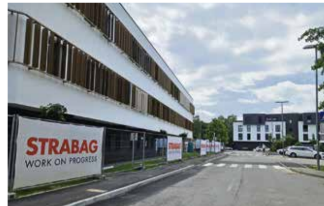
Cesta mimo novega prizidka zdravstvenega doma in lekarne Brežice je odprta za promet.

Začasni glavni vhod za uporabnike storitev, uslužbenke in obiskovalce Zdravstvenega doma Brežice do nadaljnjega ostaja z dosedanega parkirišča za uslužbenke (za stavbo ZD Brežice). Začasno parkirišče je na travniku med Knjižnico Brežice in tenis igriščem. Hvala za razumevanje.