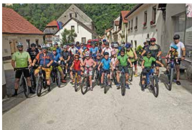
Kolesarska družina pred začetkom vožnje

BRESTANICA – Turistično društvo Brestanica je 22. junija v počastitev praznika Krajevne skupnosti Brestanica organiziralo tradicionalno kolesarjenje okoli Brestanice.