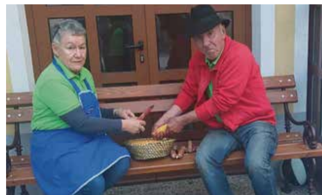
Ljudski običaj – ročno luščenje koroze