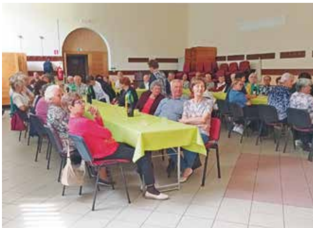
Srečanje starejših nad 70 let v organizaciji KORK Blanca je tradicionalno.