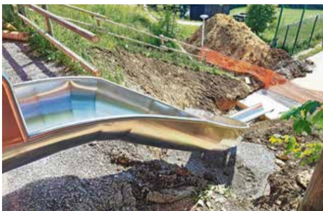
Nova pridobitev na Lisci je velik tobogan.

vseh krajevnih skupnostih. Zelo obiskana je velika napihljiva blazina na osrednjem otroškem igrišču v parku ob Savi v Sevnici, kjer je med drugim tudi fitness na prostem. Novih otroških igral so se pred kratkim razveselili na Velikem Cirkniku, v lanskem letu pa v Zabukovju in na Dolnjem Brezovem. Lokacije otroških igrišč so