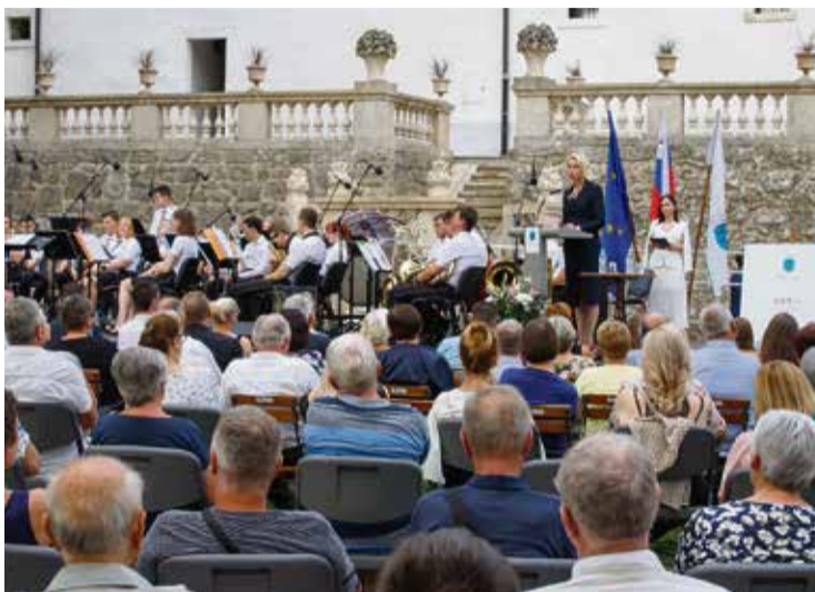
Občinstvo je z zanimanjem prisluhnilo besedam slavnostne govornice na tradicionalnem koncertu Godbe Sevnica.

svobode ter človekovih pravic in skoraj vedno tudi v vojaški konflikt. Odgovornost za porast skrajnega populizma v Evropi pa morajo, po mojem mnenju, prevzeti tudi tradicionalne politične stranke, saj njihova vodstva pogosto pozabljajo na edino pomembno poslanstvo upravljanja javne funkcije – služiti izključno interesom in blaginji državljanov in državljanov. V zadnjih letih vse prevečkrat poslušamo politike govoriti o oboroževanju z besednjakom, polnim nestrpnosti in izključevanja. 'Ni dovolj govoriti o miru, v mir moramo verjeti. In ni dovolj, da vanj verjamemo, za mir moramo delati.' To so besede ameriške vizionarke, humanistke, borke za socialno pravičnost in prve dame ZDA Eleanor Roosevelt. Naj preglasijo zlovesče besede, ki jih je v zadnjih letih veliko preveč. Tudi v Sloveniji smo osamosvojitve plačali z žrtvami. Vsaka izmed njih je tragična in vredna trajnega spomina. Takratno vodstvo države je po mojem prepričanju premoglo dovolj modrosti, da se je zavedalo, da lahko samo pogovori in samo pogajanja preprečijo eskalacijo konfliktov in krvavo vojno z množico nedolžnih žrtev.