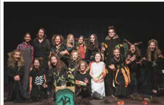
Otroška radeška gledališka skupina Zmaji