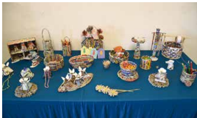
Razstavljeni izdelki Marjetic