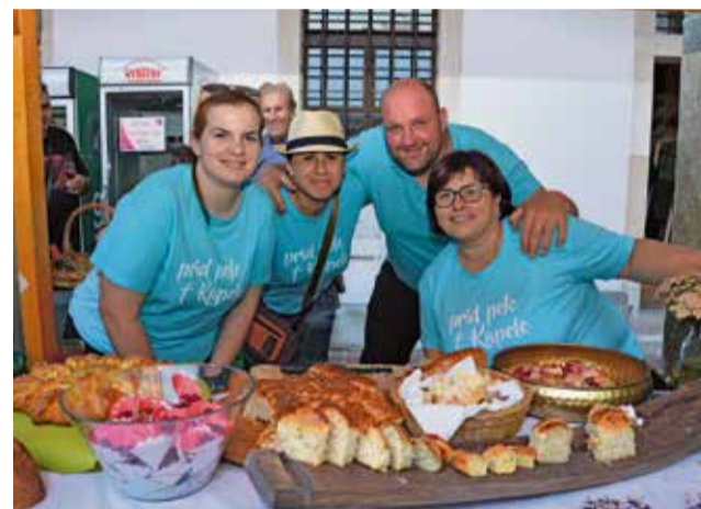
Člani TD Kapele na stojnici