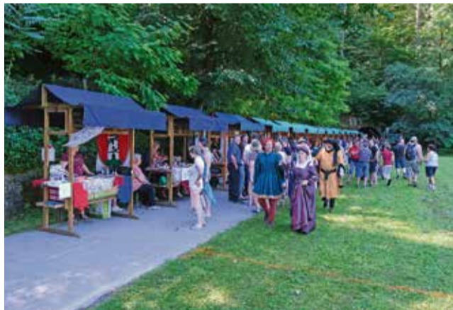
Ponudba sejmarijev je navdušila tudi grajsko gospodo.

Šaljive pohodniške igre, s katerimi so želeli opozoriti na čuvanje naravnih lepote, obnašanje in varnost na pohodih in naravi, so letos posvetili 60-letnici TD