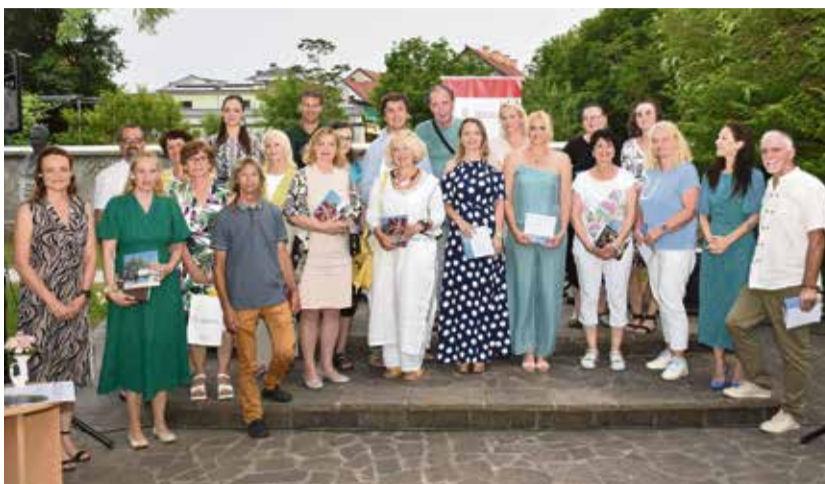
Zaključek mednarodnega pesniškega natečaja Šepetanje drevesom

V času dogodka je bila razglašena tudi lavreatka natečaja