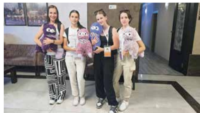
Senovska ekipa z maskotami tekmovanja – alpaki