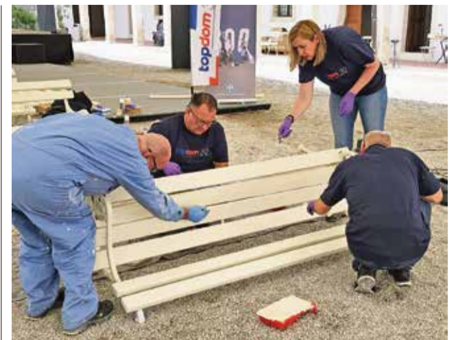
Zaposleni iz podjetja Topdom so na grajskem dvorišču v Brežicah obnavljali grajske klopi.