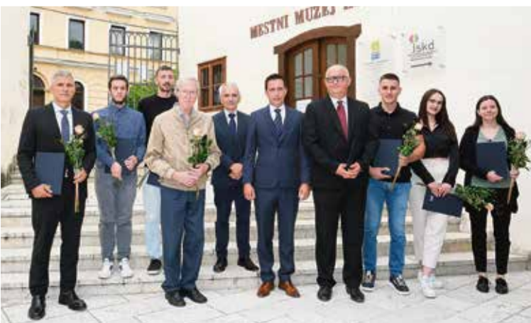
Letošnji nagrajenci z dekanom in prorektorjem