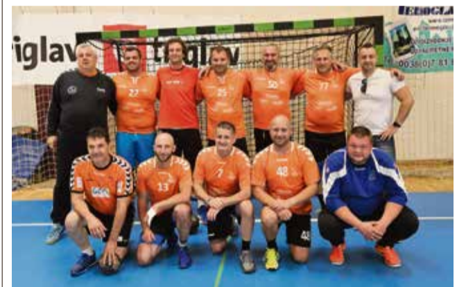
Sevniški rokometni veterani