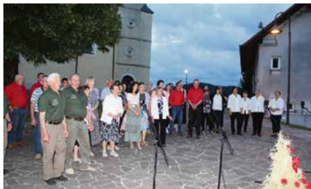
Za zaključek Šentjanškega kulturnega večera še skupna pesem vseh nastopajočih, s katerimi so zapeli tudi obiskovalci.