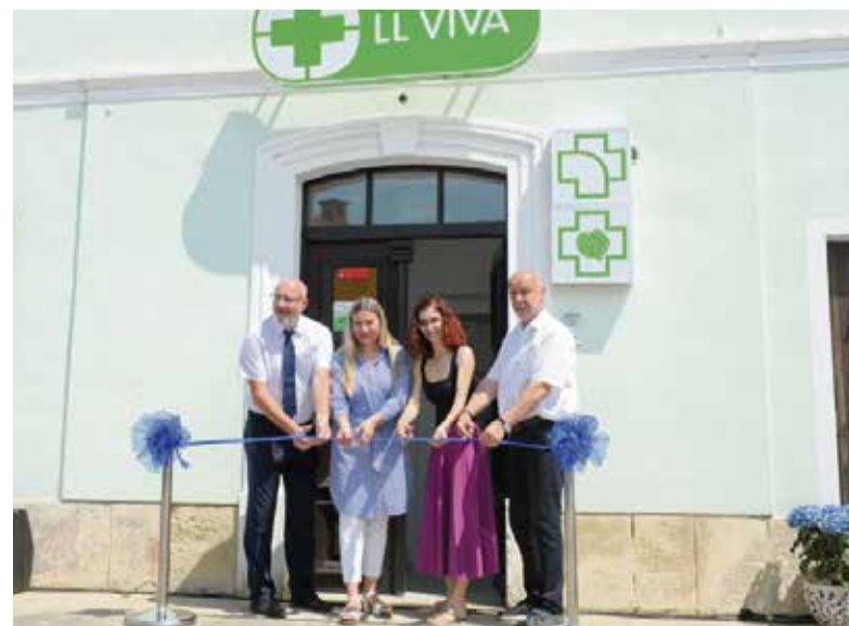
Otvoritev nove trgovine z medicinskimi pripomočki LL Viva