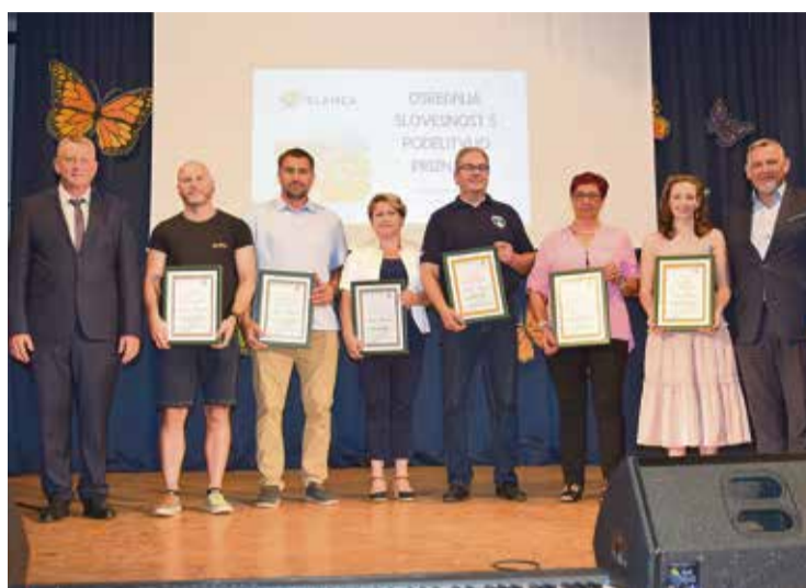
Prejemniki priznanj s predsednikom KS Blanca in sevniškim županom