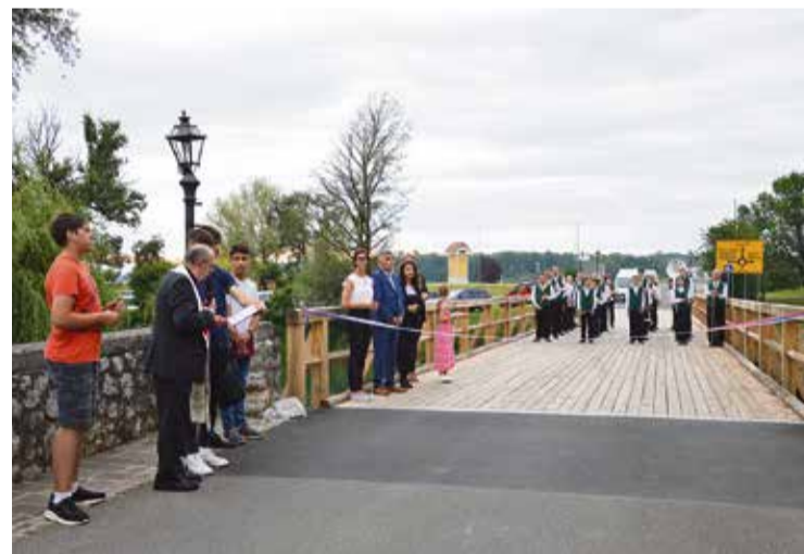
Med blagoslovom obnovljenega severnega kostanjeviškega mostu