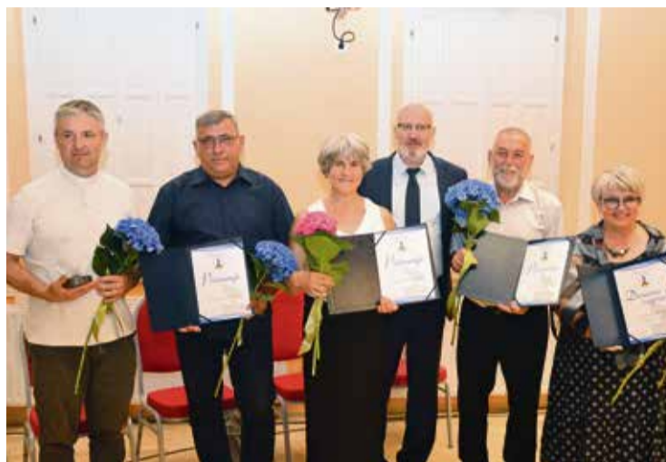
Občinski nagrajenci z županom