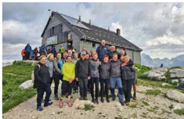
Občinski svet pred Zasavsko kočico na Prehodavcih