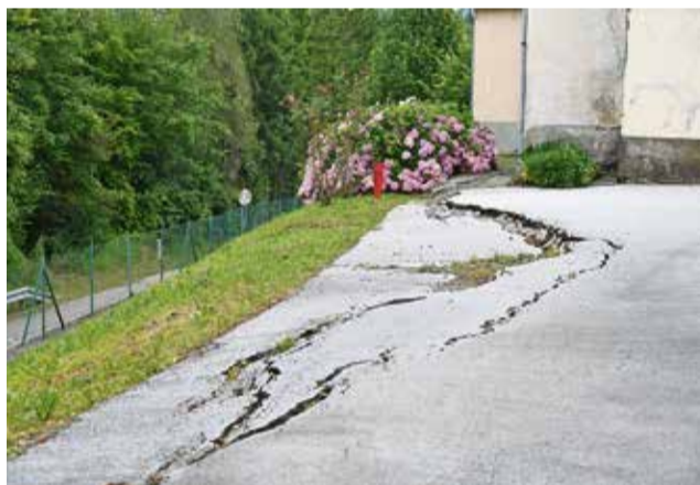
Poškodbe na dvorišču pred cerkvijo

Zaradi izvedbe nasipov in izkopov med cerkvijo in brežino proti cesti je predvidena obnova meteorne kanalizacije iz smeri od objekta in pobočja med lokalno cesto proti stabilnem delu območja.