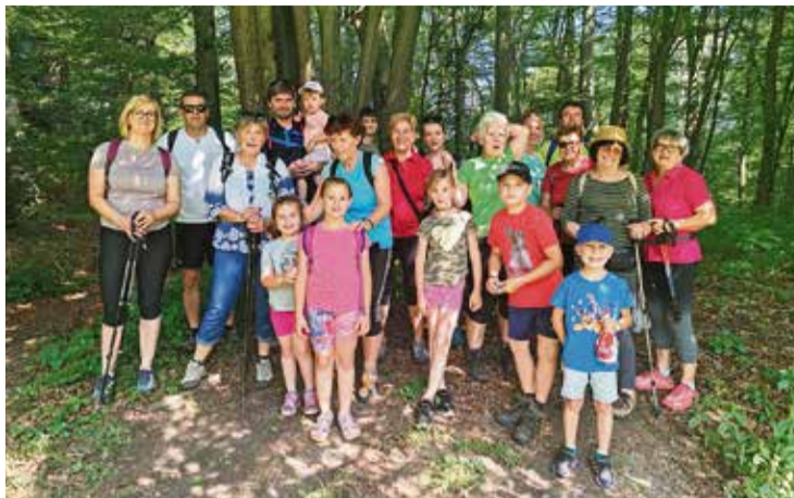
Dobro razpoložena družina pohodnikov