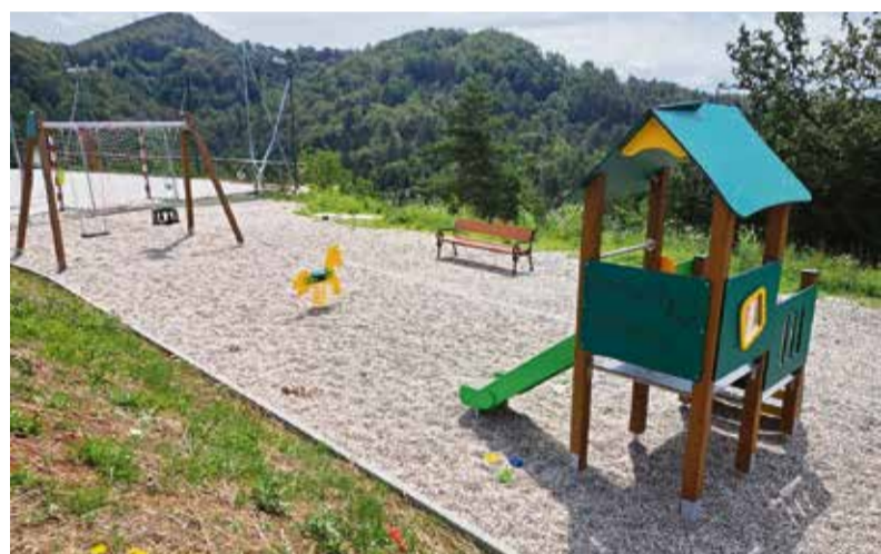
Novo otroško igrišče na Velikem Cirkniku

občanke in občane poskrbijo tudi številna društva, ki v okviru svojih dejavnosti nudijo aktivnosti za svoje mlade člane. Organizirane družabne in športne aktivnosti pa so prek različnih ponudnikov na voljo tudi širši javnosti. Poleg tradicionalnega Olimpijskega tedna, ki je potekal v prvem tednu šolskih počitnic, in Festivala mladih, ki poteka v prvem tednu julija, se mladi lahko udeležijo tudi Angleškega tabora na Lisci, poletnega tabora v naravi in pa oratorijev po župnijah v občini. Na portalu mojaobcina.si so dostopne dodatne informacije, ki so jih zbrali na KŠTM Sevnica. Med poletjem bo za otroke vsak torek popoldan, od 15. do 18. ure, odprt tudi Mladinski center Sevnica.