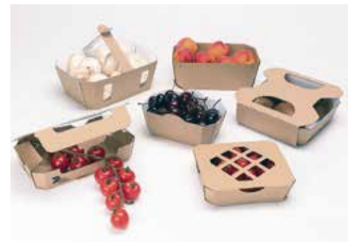
Med plastične izdelke, ki so bili umaknjeni s trgovskih polic, spadajo npr. embalaže za sadje in zelenjavo.

V podjetju stremijo k zmanjšanju odpadkov in daljši uporabi materialov. Tudi DS Smith Slovenija je odigral pomembno vlogo, saj so z embalažnimi alternativami iz valovitega kartona od leta 2020 nadomestili že več kot 1,5 milijonov kosov plastike. Med vsakdanje plastične izdelke, ki so bili umaknjeni s trgovskih polic, spadajo npr. embalaže za sadje in zelenjavo.