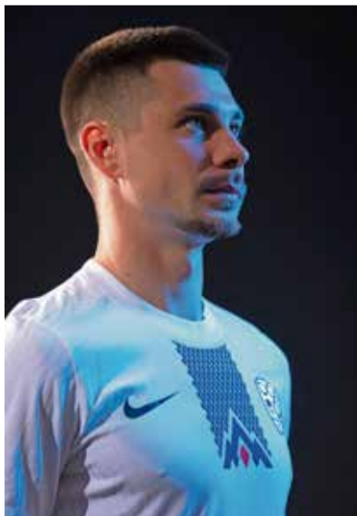
V reprezentančnem dresu

Res je. Skušam sicer pozabiti, a verjamem, da me bo to