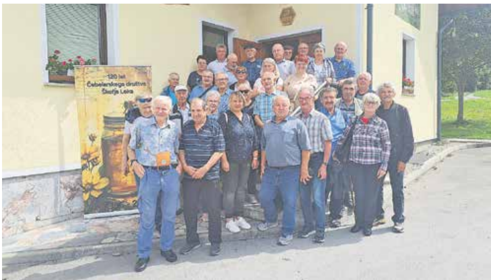
Udeleženci ekskurzije pri domu ČD Škofja Loka

BREŽICE, ŠKOFJA LOKA – Občinska čebelarstva zveza (OČZ) Brežice je na zadnjo avgustovsko soboto organizirala vsakoletno strokovno ekskurzijo za člane vseh treh čebelarstev v občini – ČD Brežice, ČD Dobova - Kapele in ČD Krška vas.