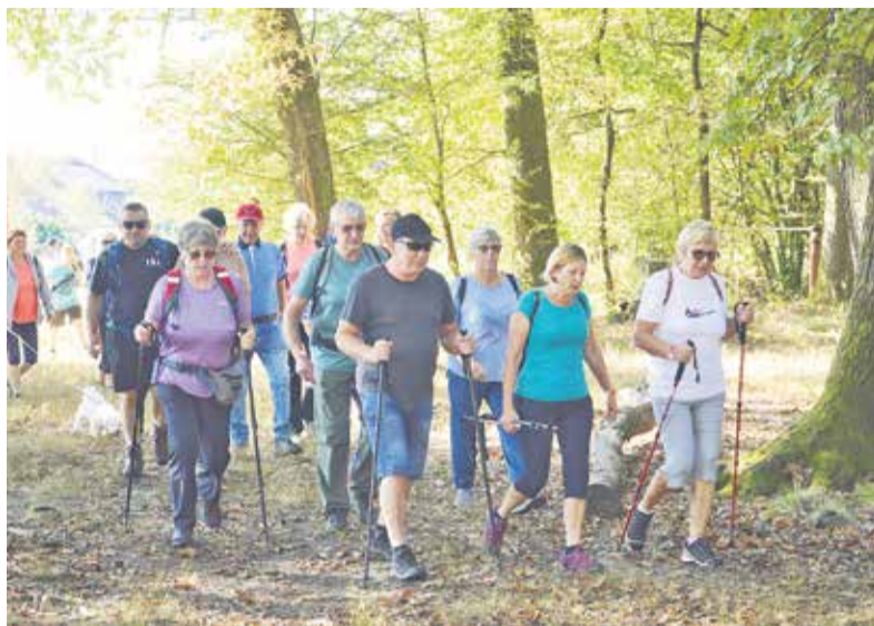
Pohodniki na začetku Artiške sadjarske pešpota v 'Banovi hosti'