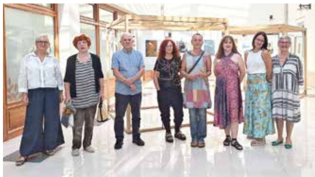
Sodelujoči na razstavi grafik