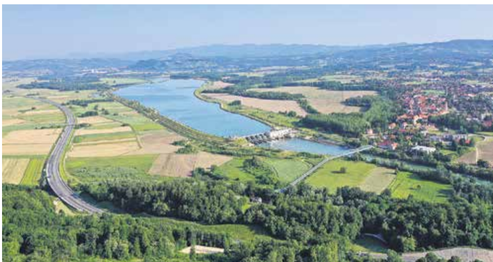
Po (še vedno nedokončanem) projektu izgradnje hidroelektrarn na spodnji Savi je pred Posavjem nov velik strateški državni projekt – drugi blok jedrske elektrarne, ki naj bi regiji prinesel nov razvojni pospešek.

odgovorni lastniki podjetij, ki ustvarjene dobičke namenjajo za prihodnji razvoj podjetij, kapital posavskega gospodarstva se približuje 3 milijardam evrov (2.919 milijonov evrov, ind. 103,3), vrednost investicij je lani znašala slabih 242 milijonov evrov (ind. 114,2), kar je spodbudno, a še vedno pod ravni investicij pred 'kronskim' časom. Opozoril je tudi, da imajo nekatera podjetja (zlasti tista v tuji lasti), ki se želijo širiti na obstoječih lokacijah, težave z zakonodajo, konkretno s predlogom uredbe o varovanju vodnih virov v mestni občini Krško, ki otežuje gradnjo novih objektov v Poslovni coni Drnovo. Na javni predstavitvi Pobude za JEK2 je bilo podobna opozorila slišati tudi zaradi (preobsežnega) območja državnega prostorskega načrta za ta projekt in predvidenega območja omejene rabe prostora zaradi (novega) jedrskega objekta. 1.954 samostojnih podjetnikov v regiji, ki so lani zaposlovali 1.893 delavcev, je prihodke povečalo na skoraj 292 milijonov evrov (ind. 105,3), pri tem pa so ustvarili 19,9 milijona evrov (ind. 101,8) neto podjetnikovega dohodka, 86,7 milijona evrov (ind. 105,2) dodane vrednosti oz. 45.813 evrov (ind. 107,0) dodane vrednosti na zaposlenega. 20 posavskih zadrug je povečalo prihodke na dobrih 36 milijonov evrov (ind. 101,5), dodano vrednost na zaposlenega na 33.349 evrov (ind. 110,6), žal pa so