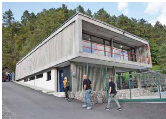
Obnovljena vstopna kopalniška stavba, v kateri bo v gornjem nadstropju urejen Paviljon papirne umetnosti.

V vstopni kopalniški stavbi, ki se nahaja na arheološkem najdišču iz halštatske dobe, zato so obnovitvena dela potekala pod strogim nadzorom celjske enote Zavoda za varstvo kulturne dediščine Slovenije ter pooblaščenega arheologa, so bili obnovljeni vsi prostori. V pritličju so prenovljeni sanitarni prostori, tuši, garderobe ter pisarne. V zgornjem nadstropju so prostor zasteklili in ga uredili kot večnamenskega, tako da bo na voljo v vseh letnih časih za izvedbo različnih dogodkov. V celoti so zamenjali ogrevalni sistem, na novo je urejena razsvetljava, obnovljeno zunanje stopnišča krasi nova ograja, nova je tudi fasada. Zunanje betonske palice, ki so dragocen primer modernistične arhitekture iz 50. let 20. stoletja, imajo po prenovi svež sijaj in še izraziteje poudarjajo estetsko edinstvenost vhodne