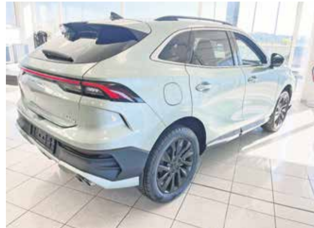
Forting T5 EVO

V Avto Dobova dajejo velik pomen povezanosti s skupnostjo, zato aktivno sodelujejo na lokalnih dogodkih in podpirajo projekte, ki prispevajo k razvoju regije. Vrata salona so vedno odprta za vse, ki