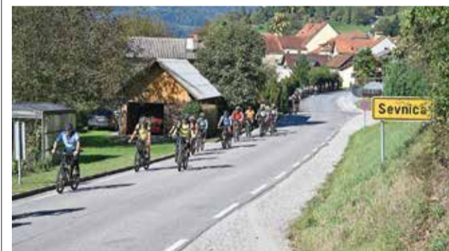
Kolesarji na poti iz Sevnice proti Krškem

Aktivnost je sofinancirana s sredstvi Evropskega sklada za pomorstvo, ribištvo in akvakulturo. Za vsebino je odgovorna Občina Sevnica. Organ upravljanja, določen za izvajanje Programa ESPRA 2021-2027, je Ministrstvo za kmetijstvo, gozdarstvo in prehrano.