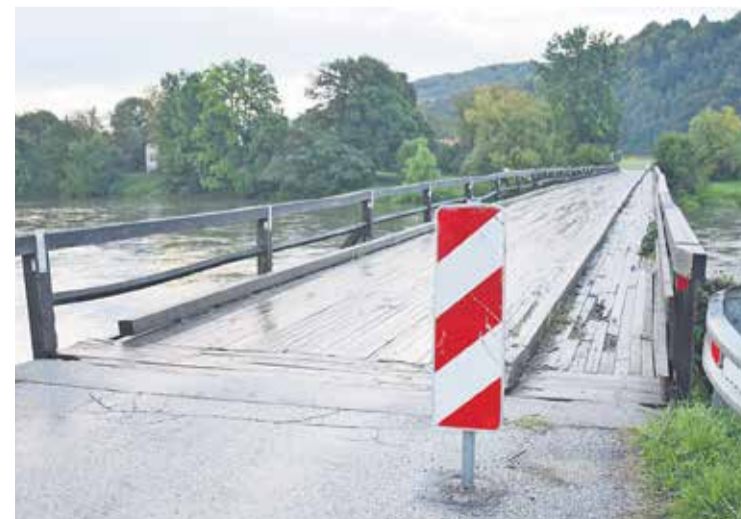
Most na Brodu je kljub večkratnim večjim obnovam in manjšim popravilom pogosto v že na videz zelo slabem stanju.