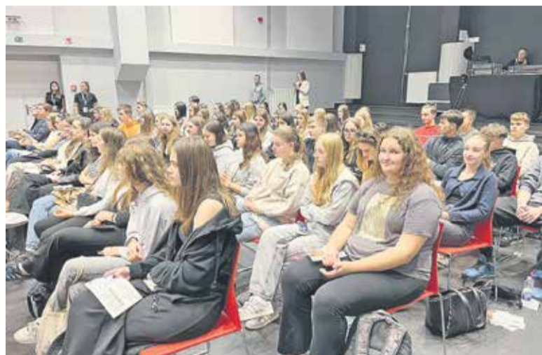
Dogodek je privabil številne mlade, ki so tako napolnili dvorano v MC Brežice.