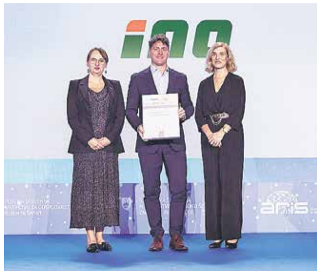
Srebrno nacionalno priznanje je prejelo tudi podjetje INO Brežice