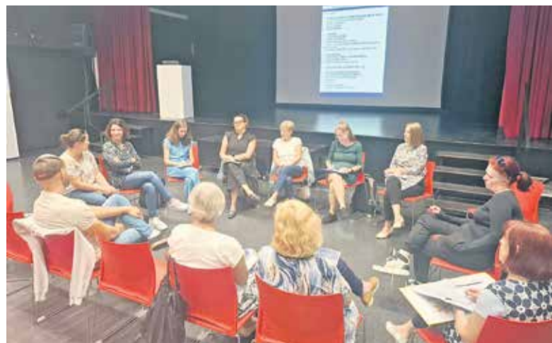
Udeleženci Lokalne akcijske skupine med razpravo

Občina Brežice se sooča z eno najpomembnejših družbenih sprememb – demografskim staranjem prebivalstva. Ta izziv sprejema kot priložnost za krepitev skupnosti in gradnjo trajnostne prihodnosti za vse generacije. Zato se v občinski upravi odločno in proaktivno lotevamo oblikovanja javnih politik, ki bodo kakovost življenja naših prebivalcev ohranile na najvišji možni ravni.