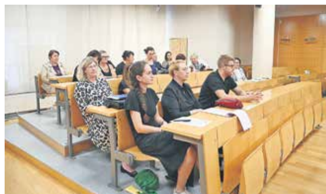
Sejo so v ozadju spremljali predstavniki zaposlenih v OŠ dr. Mihajla Rostoharja Krško in nekateri starši učencev.