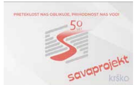
V letošnjem letu je družba dopolnila 50 let obstoja projekta.

Namesto da bi posebej izpostavljali posamezne objekte, raje poudarjamo celoto: raznolikost področij, ki jih pokrivamo, in sposobnost, da jih povežemo v trajnostne, izvedljive in kakovostne rešitve. Prav ta širina referenc nam daje moč in prepoznavnost, saj se naš pečat kaže v prostoru, kjer ljudje živijo, delajo in ustvarjajo prihodnost.