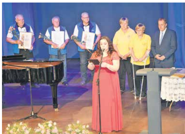
Prejemniki županovega priznanja s prvim možem radeške občine in povezovalko slavnostne seje ob občinskem prazniku