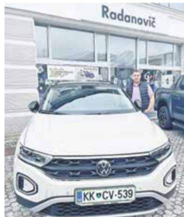
T-Roc je v zadnjem letu postal številka ena med vozniki v Posavju. Novi model prihaja kmalu.