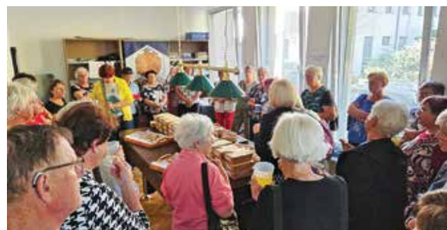
V sklopu promocijskih aktivnosti je bil ribji namaz predstavljen še na dveh dogodkih, ki sta potekala v Večgeneracijskem centru Posavje+ v Sevnici.

Dolgoletni projekt štirih občin Posavske regije tako združuje šport, druženje in odgovoren odnos do okolja. Dogodek vsako leto potrjuje, da se zmorejo s sodelovanjem in povezovanjem ustvarjati prijetne zgodbe, ki presegajo občinske meje. Kolesarjenje ob Savi je več kot le športna preizkušnja – je praznik druženja, gibanja in skupnih prizadevanj za trajnostno prihodnost Posavja.