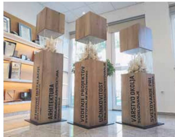
Trije glavni stebri storitev: inženiring, urbanizem, projektiranje