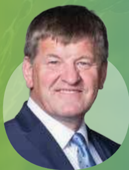
FRANC BOGOVIČ nekdanji kmetijski minister