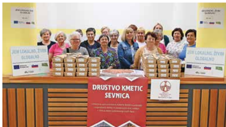
Članice Društva kmetič Sevnica in Društva podeželskih žena Pod Gorjanci na Kmečki tržnici v Sevnici

Nizka ozaveščenost prebivalcev regije Posavje o prednostih uporabe sladkovodnih rib in lokalnih surovin je, kljub številnim prizadevanjem sodelujočih partnerjev v različnih projektih, še vedno prisotna. Nakupovalni vzorci in hiter življenjski slog nam krojijo življenje in otežuje spreminjanje navad. Kljub temu partnerji projekta Jem lokalno, živim globalno verjamejo, da bodo prebivalci posavske regije prepoznali prednosti lokalno pridelane in kakovostne hrane. Takšna hrana pomeni manj vpliva na okolje, saj je pridelana bližje potrošniku, prav tako pa daje večjo vrednost lokalnim proizvajalcem, ki so bolj povezani z družbenimi potrebami in izzivi. Lokalno pridelana hrana je pomembna tudi za razvoj trajnostnega turizma, v katerega se na območju LAS Posavje vlaga