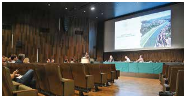
Sestanek o umeščanju JEK2 v prostor

Mestna občina Krško bo v prihodnjih tednih zbrala pripombe in predloge vseh deležnikov ter jih povežala v enoten dokument, ki bo izražal voljo lokalne skupnosti. Kot je poudaril župan, je to šele začetek procesa, ki bo temeljil na stalnem in odprtem dialogu.