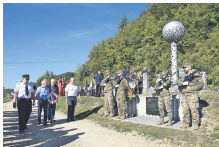
Pred osrednjo spominsko slovesnostjo je potekala položitev venca k spomeniku padlim partizanskim kurirjem v vasi Okroglice.

Spomin na kurirsko postajo S-5 kot eno »ključnih žil v času narodnoosvobodilnega boja« je v svojem govoru obudil tudi slavnostni govornik – minister za gospodarstvo, turizem in šport Matjaž Han. Ta je kurirje opisal kot pomembne posameznike, ki so s prenašanjem sporočil obvarovali marsikatero življenje, skupnost pa je bila povezana v boju proti okupatorju. »To niso le zgodbe iz zgodovine – to so temelji naše svobode, ki jih moramo