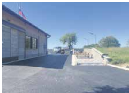
Ureditve na Škovcu

Projekt Sobivam, sodelujem, soodločam – Participativni proračun Občine Sevnica se je skozi večletno izvajanje uveljavil kot primer dobre prakse uspešnega