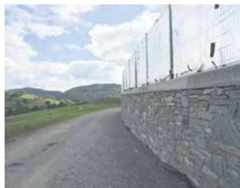
Oporni zid za igrišče

prilagojeno zunanje šolsko športno igrišče predstavlja zadnji pridobi-