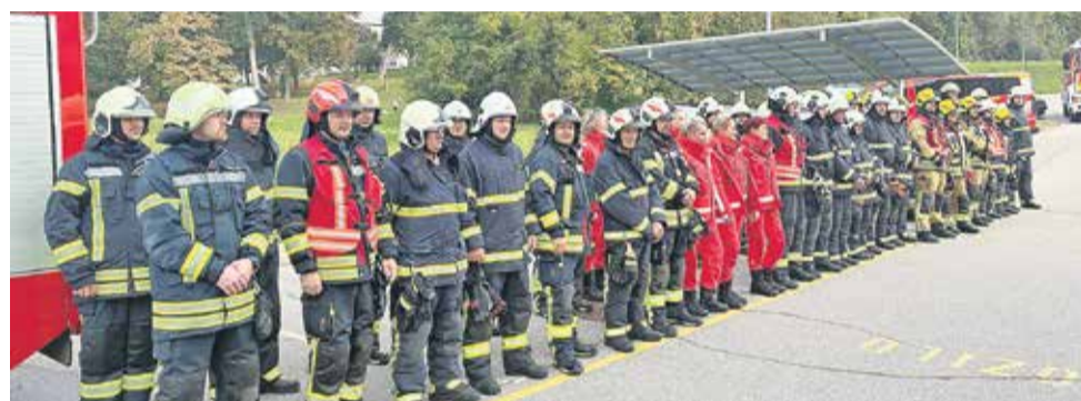
Postroj sodelujočih na vaji na lokaciji Doma upokoencev Brežice

so z reševalnim čolnom CZ Občine Brežice izvedli reševanje oseb s prevrnjenega plovila na Krki. Brežice je preletaval tudi vojaški helikopter. Vaja je tako združila več kot 1500 udeležencev iz več kot 35 organizacij.