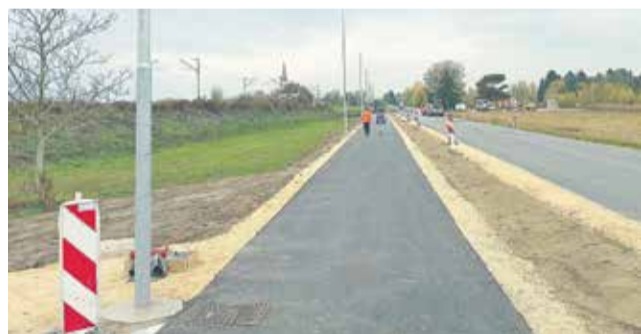
Urejanje večnamenske poti med Dobovo in Rigoncami

evrov, od tega za skupna vlaganja v lokalno infrastrukturo 440.000 evrov in 40.000 evrov za potrebe opremljanja gasilskih društev. Poleg rekonstrukcije ceste in pločnika iz teh sredstev občina sofinancira še projekt Modernizacija LC 191143 Veliki Podlog–Hrastje–Črešnjice–Cerklje (od 4.014 m do 4.202 m) v dolžini cca 150 m in pripravo projektne dokumentacije za Vodovod Cerklje.