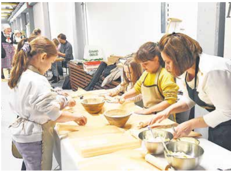
Delavnica priprave rudarske grebljice

Projekt sta sestavljala dva javna čezmejna dogodka: 25. maja sta v Rudah posebnosti svoje rudarske dediščine predstavila