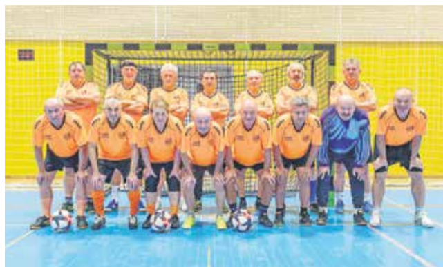
Igralci obeh brežiških ekip

BREŽICE – 5. oktobra je v Športni dvorani Brežice potekalo mednarodno srečanje ekip v hodometu, ki ga je organiziral NK Brežice 1919.