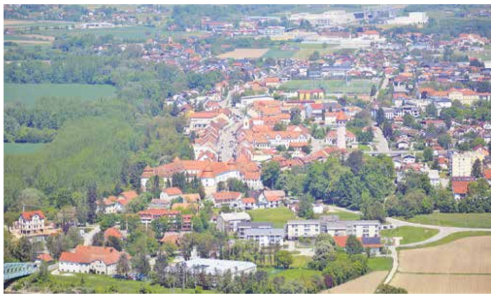
Pogled na mesto Brežice z razgledne ploščadi na Svetem Vidu

BREŽICE – V naslednjih dneh se bo zvrstilo še nekaj dogodkov letošnjega Brežiškega oktobra, ki svoj vrhunec vedno doživi zadnji vikend tega meseca, ko je organiziran tradicionalni pohod po poteh Brežiške čete, ki ji občina Brežice tudi posveča svoj praznik.