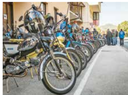
Vožnja s Tomos motorji je ponudila nepozabno doživetje.

V sončnem dnevu je udeležence »moto srečanja« panoramska vožnja popeljala po prekrasnih koticah sevnške občine s postanki pri lokalnih pridelovalcih in gostincih. Posebno doživetje je bil ogled železniške makete na železniški postaji v Sevnici, ki se razteza na površini