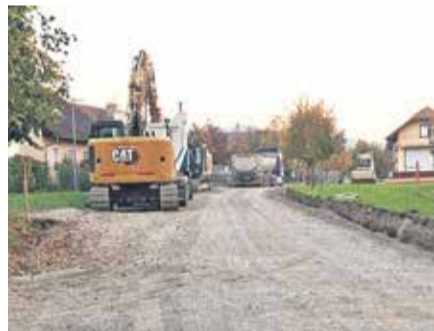
Potek del v Dolenji Pirošici

Začela so se izvajati dela za izvedbo projekta Rekonstrukcija ceste s pločnikom v Dolenji Pirošici 1. faza (cesta v naselju s pločnikom in JR) in 2. faza (cesta izven naselja). Projekt obsega rekonstrukcijo lokalne ceste LC 02064 LC 024064 Gorenja Pirošica–Dolenja Pirošica (od 0+0 km do 0+660 km) in LC 024063 Boršt–Gorenja Pirošica (od 1+489 km do 1+538 km). Cesta se bo v celotni dolžini (cca 700 m) rekonstruirala na širino vozišča 5,0 m, v dolžini cca 430 m pa bo dograjen enostranski pločnik širine 1,5 m. Hkrati se bo uredilo tudi odvodnjavanje ceste in cestna razsvetljava.