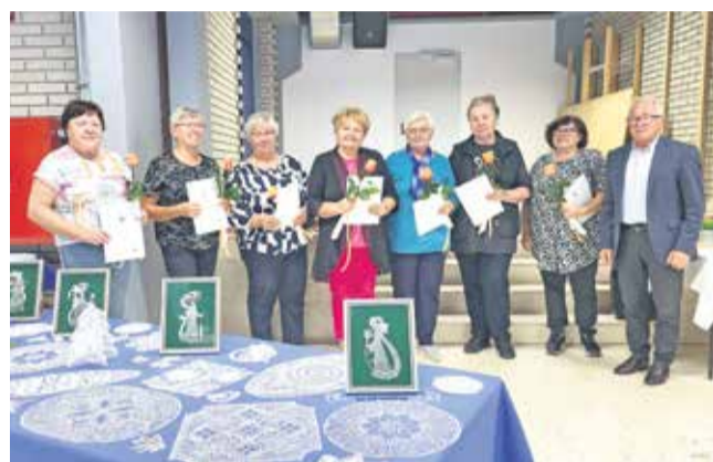
Predstavnice sodelujočih društev s predsednikom PZDU Posavje

Košuto navadnega jelena za meso in suhe lanske bale sena prodaj . Tel.: 041 613 954