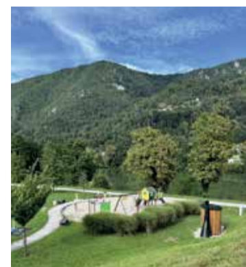
Ekološko stranišče ob reki Savi