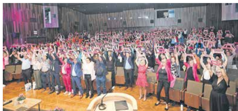
Skupinska vadba udeležencev pod vodstvom strokovnjakinj CKZ