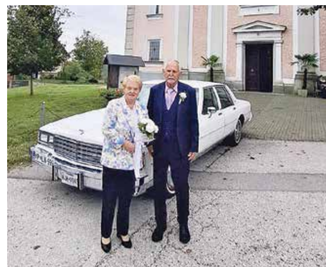
Zlatoporočenca pred cerkljansko cerkvijo