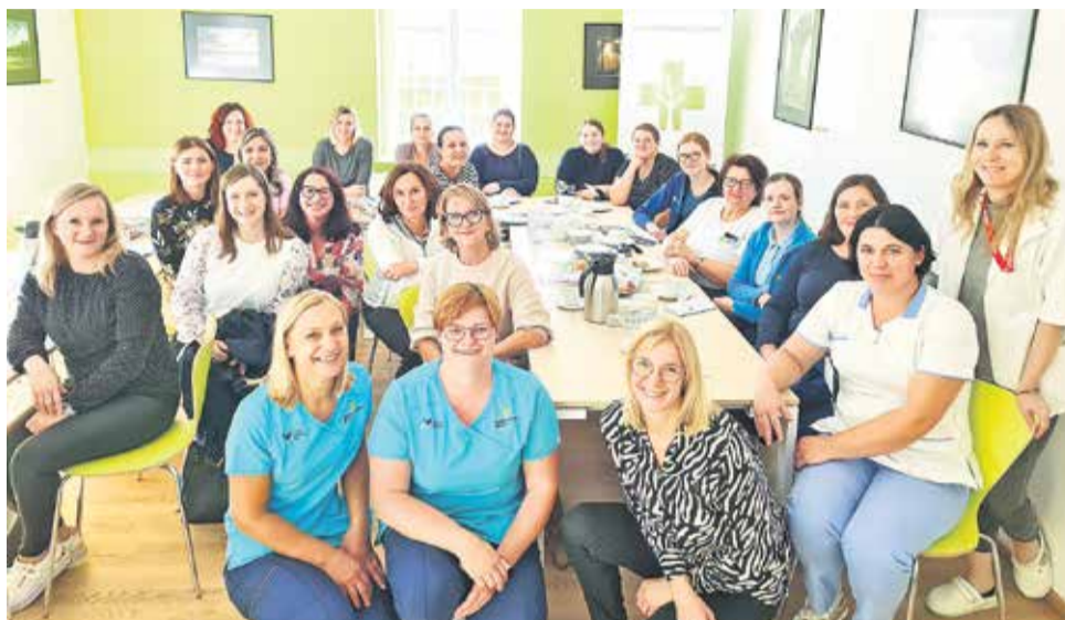
V začetku oktobra so v Splošni bolnišnici Brežice organizirali predstavitev Mobilnega paliativnega tima Posavje za patronažne sestre z njihovega območja.

V Sloveniji na področju paliativne oskrbe kljub nekaterim korakom naprej precej zaostajamo za standardi Evropskega združenja za paliativno oskrbo, ugotavljajo poznavalci tega področja. »V primerjavi z državami z razvito, močno mrežo paliativne oskrbe je Slovenija skoraj na začetku,« meni sogovornica iz brežiškega paliativnega tima. V Sloveniji je na voljo specializirana paliativna oskrba v okviru bolnišnic – v dveh univerzitetnih kliničnih centrih in v regionalnih splošnih bolnišnicah – v obliki mobilnih paliativnih timov, vendar se 80 % osnovne paliativne oskrbe izvaja na primarni ravni zdravstva pri izbranih osebnih zdravnikih, z izdatno izvedbeno pomočjo patronažnih sester in centrov za socialno delo. »Na sistemski ravni je treba težiti k oskrbi bolnikov na njihovih domovih