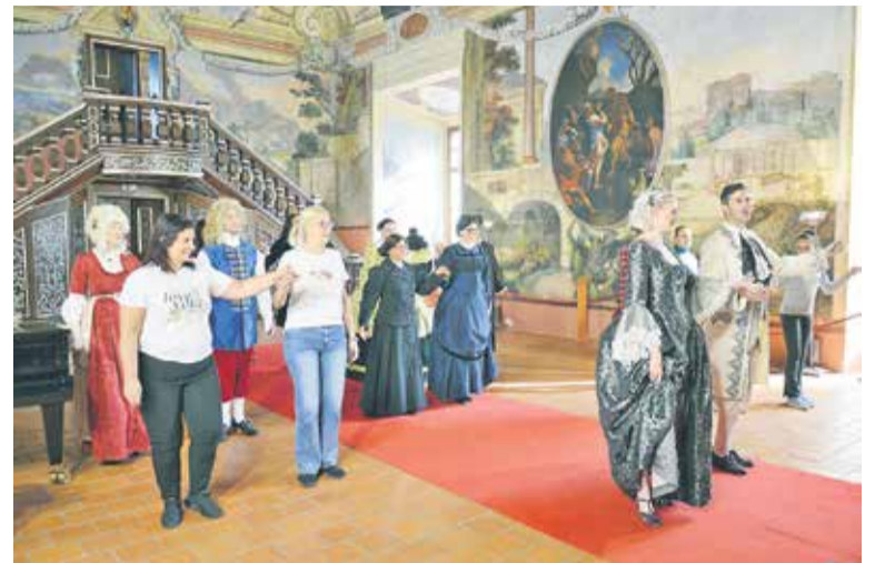
Delavnica baročnih plesov v Viteški dvorani

Posavski muzej je v sodelovanju z Dvorcem Trakoščan s Hrvaške pripravil osrednji dogodek projekta Prepletene pridne roke , akronim: EU4Crafts . Potem ko so že teden prej podobno z barokom zaznamovan dan pripravili na Hrvaškem, so bili 4. oktobra rokodelstvo, baročna umetnost in kolektivni spomin povezani v celoto še v brežiškem gradu.