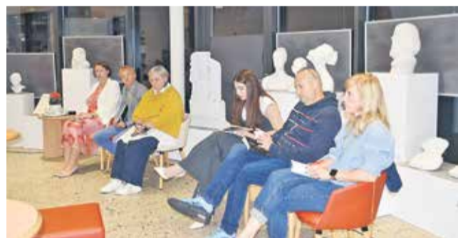
Odlomke iz literarnih del je na glas brala izbrana šesterica bralk in bralcev.