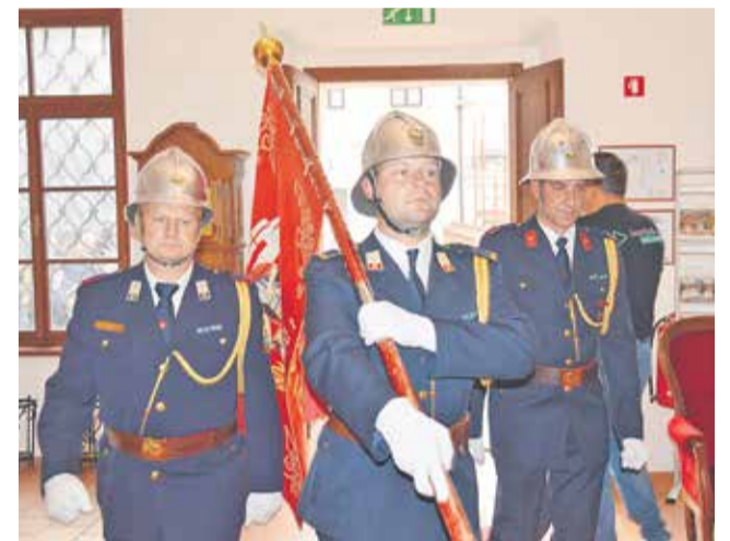
Prihod prapora GZ Brežice v Viteško dvorano