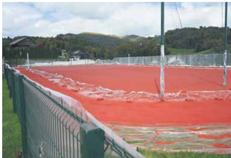
Tartanska obloga na igrišču v začetku oktobra

V teh dneh se zaključujejo ureditvena dela za novo šolsko športno igrišče, ki je umeščeno ob Osnovno šolo Milana Majcna Šentjanž.