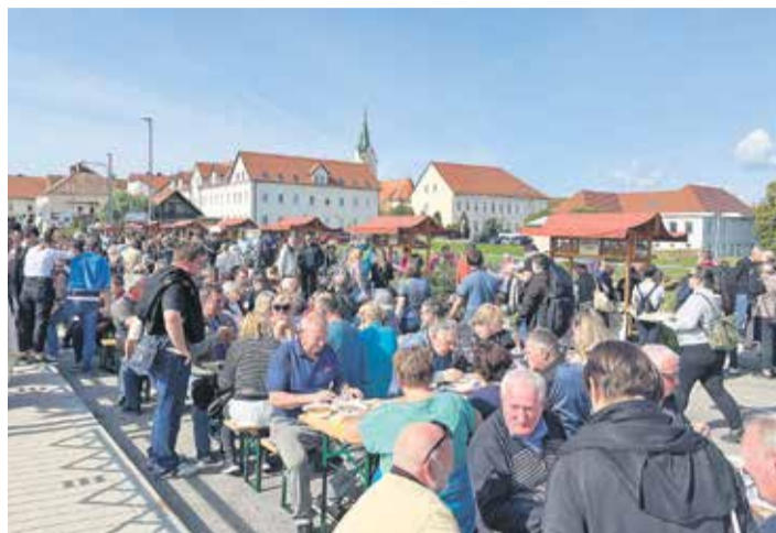
Vznožje brežiškega vodovodnega stolpa je pokalo po šivih.

Tradicija kuhanja županovega golaža sega v leto 2012, ko so