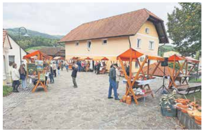
Bogata ponudba tržnice