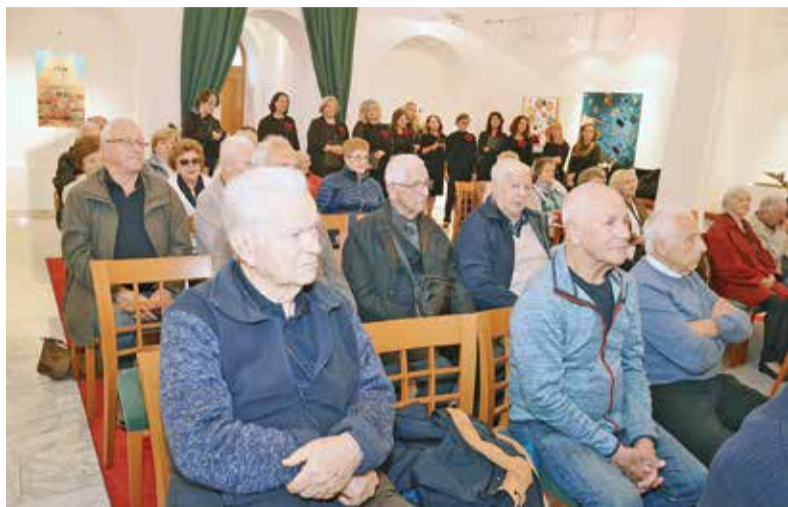
S prireditve DIS Krško, zadaj pevski sestav Melodina