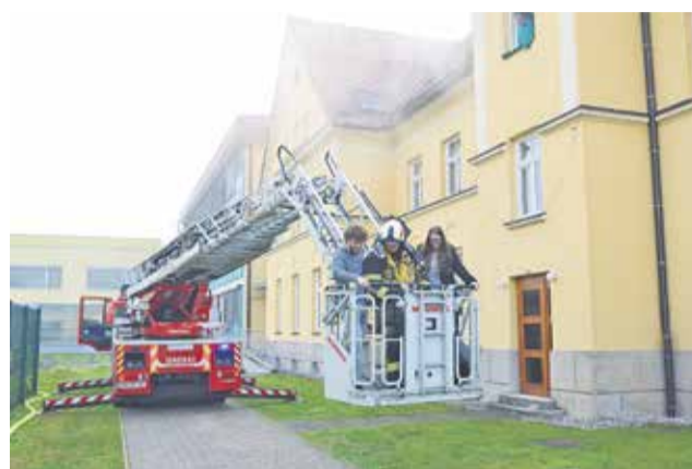
Med reševanjem v šolski stavbi ujetih gimnazijcev

nazije Brežice, reševalna služba ZD Brežice, Komunala Brežice in Slovenska vojska s helikopterjem. Na vseh lokacijah, kjer je na stavbah prišlo tudi do požarov, so bile med evakuiranimi tudi poškodovane in negibne osebe, ki so jih večinoma gasilci reševali in pomagali osebju pri njihovi evakuaciji. Na lokaciji Vadbišča sil zaščite in reševanja občine Brežice Slovenska vas so praktično preizkusili delovanje naprave za iskanje zasutih v ruševinah, saj so iz porušene hiše izvlekli najdeno zasuto težje poškodovano osebo. Ob obali Jamnikove parcele na Velikih Malencah pa