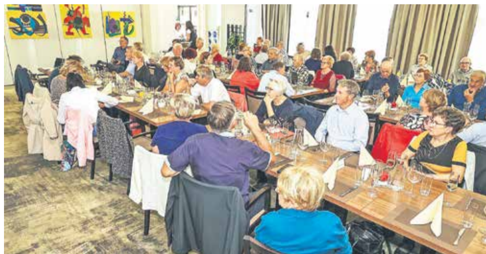
S prireditve ob jubileju DRS – podružnice Posavje