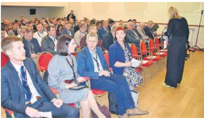
Srečanja se je udeležilo okoli 200 menedžerjev in strokovnjakov za proizvodnjo.