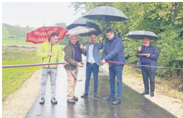
Svečana otvoritev asfaltirane ceste je potekala v dežju.