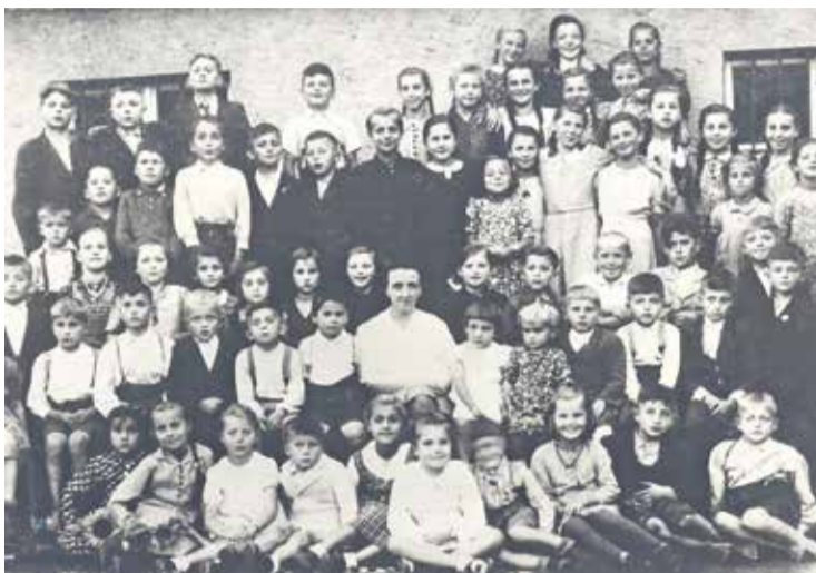
Šolarji, med njimi več otrok iz naših krajev, v taborišču Rittmannshausen.