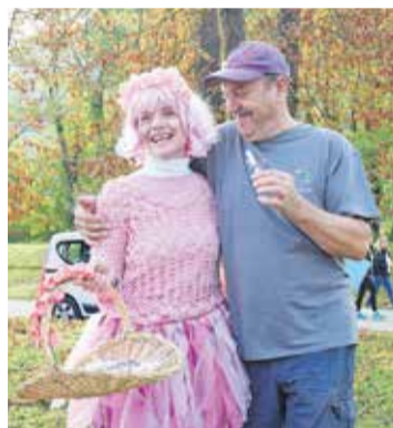
Dobra vila je razveseljevala z lističi z dobrimi mislimi.

Pred preizkusom hoje na 2 kilometra in tekaškimi preizkusnjami so prijeten kulturni program z zapetimi skladbami in plesom pripravili učence in učenci šentjanjske osnovne šole, v kateri so ponosni tudi na mlada