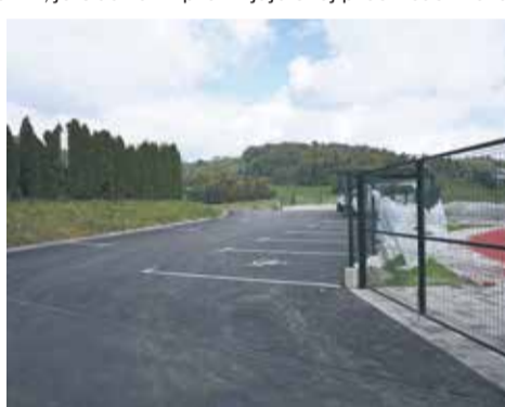
Novo parkirišče za zaposlene

cest v državnih načrtih za realizacijo časovno zamaknil, je Občina Sevnica pristopila k prilagoditvi projekta in pridobila odločbo o spremembi gradbenega dovoljenja, na podlagi katerega so se v lanskem letu tudi začela gradbena dela. Občina Sevnica je ob tem tudi uspešno pridobila sredstva za sofinanciranje gradnje. Projekt v izvedbeni vrednosti 774.661,07 evra je sofinanciralo Ministrstvo za gospodarstvo, turizem in šport v višini 100.000 evrov in Fundacija za šport v višini 55.728 evrov.