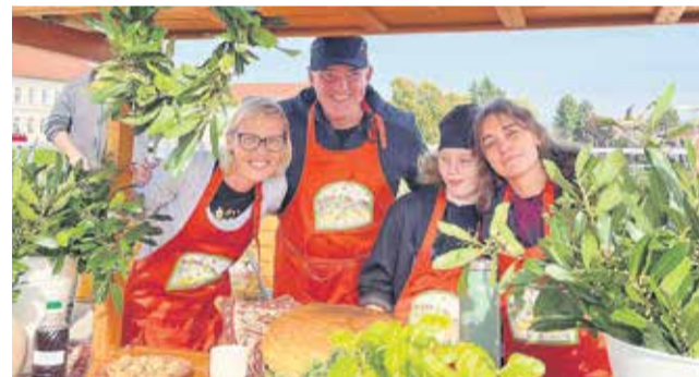
... najlepše pa je stojnico okrasilo TD Zakot-Bukošek-Trnje.