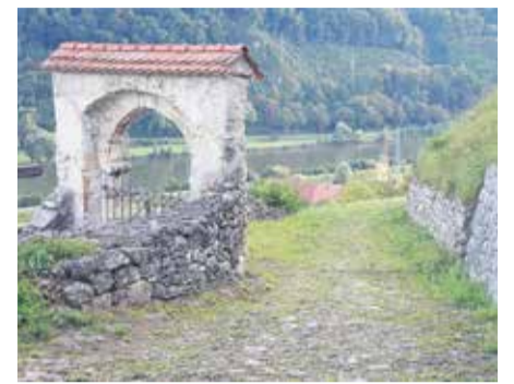
Pešpot na sevniški grad vodi mimo Lutrovske kleti.

Občanke in občani ter tudi obiskovalke in obiskovalci prireditelj na sevniškem gradu so že večkrat izrazili željo po ureditvi javne razsvetljave, namestitvi varovalne ograje ob robu poti ter postavitvi klopi za počitek. Ali je takšna ureditev mogoča? Sevniška občinska uprava odgovarja, da je območje gradu, njegovega pobočja in starega trškega jedra spomeniško zaščiteno. To pomeni, da je vsaka ureditev gradu in njegove širše okolice mogoča le v sodelovanju s pristojno območno službo Zavoda za varstvo kulturne dediščine Slovenije.