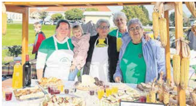
Zmagovalni županov golaž je skuhalo TD Velike Malence ...