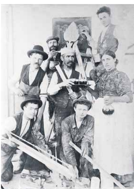
Postrežba brežičkih obrtnikov (mizarji, soboslikarji in natakarija) med opravljanjem obrtniških del v začetku 20. stoletja