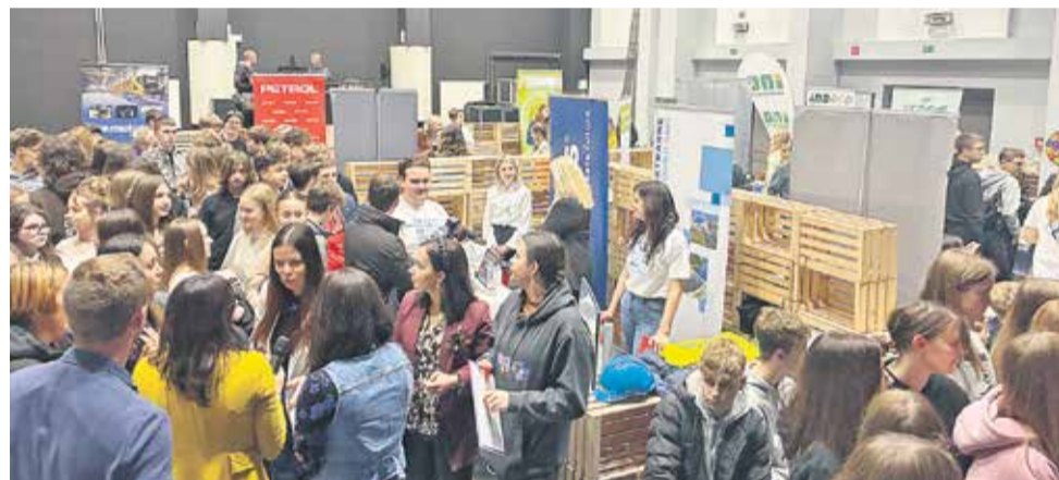
Dvorano MC Brežice so napolnili mladi ter se sprehodili med stojnicami podjetij in ustanov.

BREŽICE - Na prvo oktobrsko soboto je v Posavskem muzeju Brežice že tradicionalno potekal sejem rokodelskih znanj in veščin, a letos je, tudi zaradi lokacije stojnic, dogodek potekal drugače, saj je bil ta dan tudi Baročni dan.