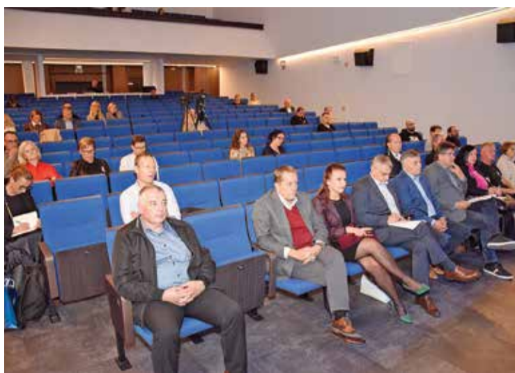
Predstavitve je potekala v (bolj praznem kot polnem) Domu kulture Brežice.