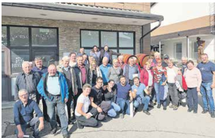
Članice in člani sevnškega govedorejskega društva so se na izletu v Belo krajino seznanili tudi s primeri dobrih praks v živinoreji. (Foto: Urša Sreš).

Po zaključeni šolski uri so se udeležence in udeleženci izleta odpeljali po slikoviti gričevnati pokrajini ter s praproto poraslimi travniki, ki jim tu rečejo stelniki, do Kmetijske zadruge Metlika. Predstavitev zadruge,