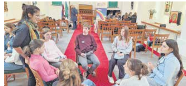
Osrednji del srečanja so bile delavnice.