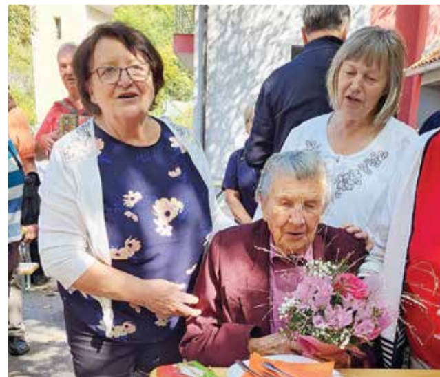
Čestitke najstarejši udeleženki srečanja