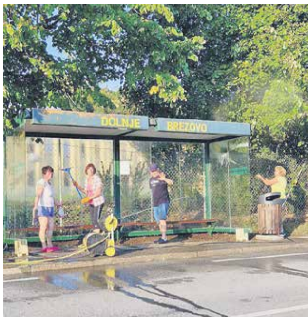
Vaščanke in vaščani so se pred začetkom novega šolskega leta lotili ureditve dveh avtobusnih postajališč v svoji vasi.

Na pobudo krajanek in krajanov se je odzvala Občina Sevnica, ki je pohvalila prizadevanja za urejenost njihovega bivanjskega okolja. »Vaša akcija čiščenja avtobusnih postajališč in okolice daje pomemben zgled, kako lahko s